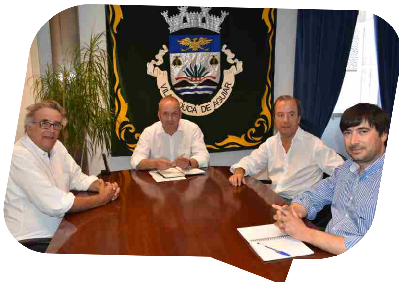
Autarcas aguiarenses reuniram com vereador da autarquia de Lisboa para abordar o termalismo