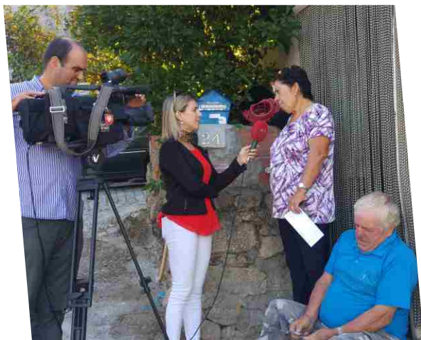
A SIC fez uma reportagem no concelho sobre os apoios da autarquia à comunidade sénior