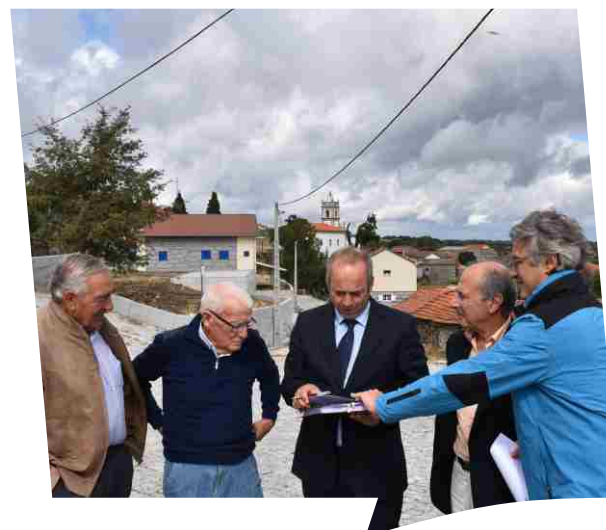
Receção provisória da empreitada Repavimentação no interior da Localidade de Afonsim