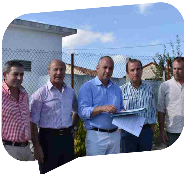
Consignação da empreitada Substituição da Conduto Adutora de Água em Tinhela de Cima