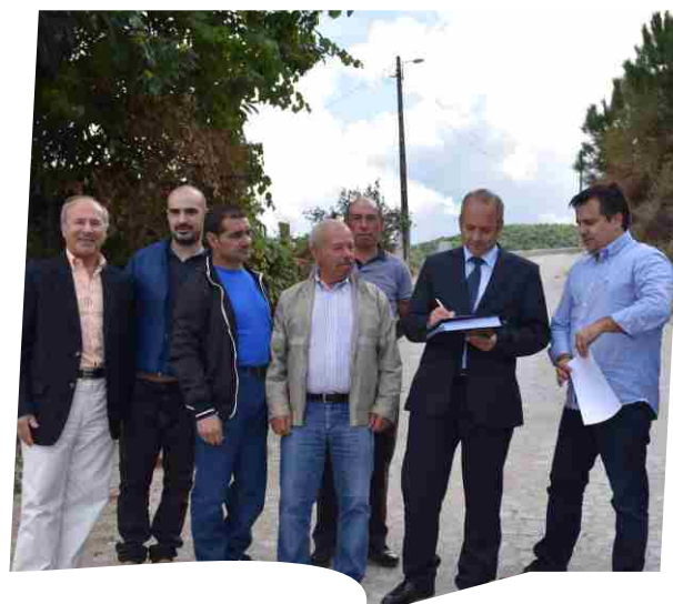
Receção Provisória da empreitada Pavimentação da Rua das Palas em Vilarinho de S. Bento