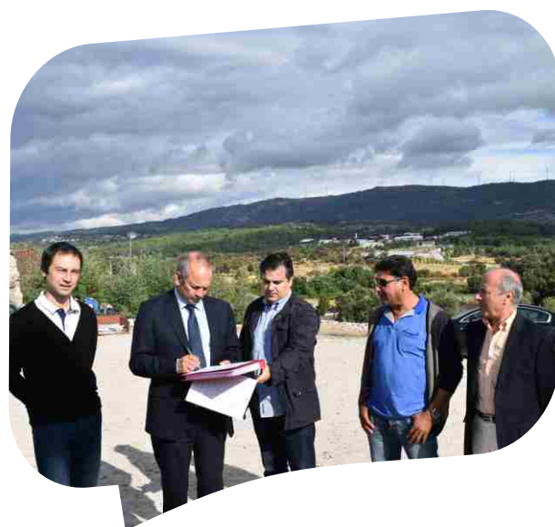
Consignação da empreitada Requalificação do Largo da Capela em Sabroso de Aguiar