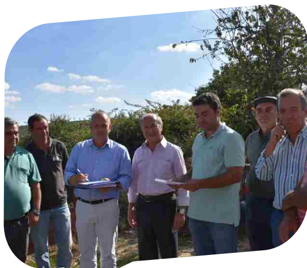
Consignação da empreitada Acesso ao Ponto de Água do Alto Perdilheira em Tinhela de Baixo