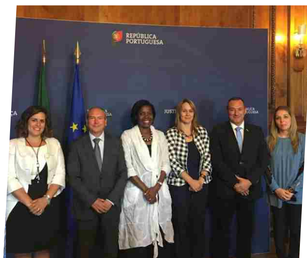
Autarcas reúnem com a Ministra da Justiça e conseguem manter Gabinete de Medicina Legal no Alto Tâmega...