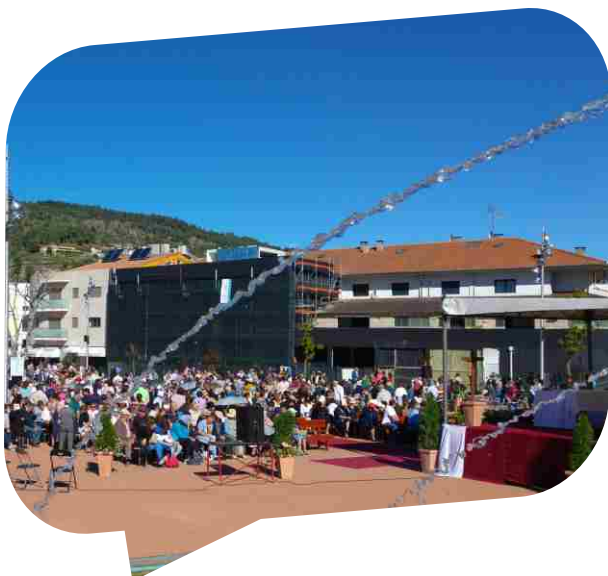
Centenas de pessoas participaram na Peregrinação Jubilar da Misericórdia