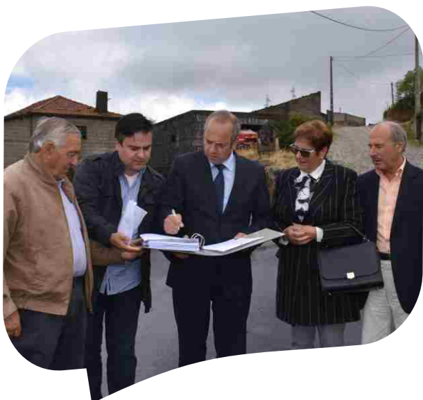
Receção provisória da empreitada Repavimentação do Caminho Municipal 1153 - Gouvães da Serra