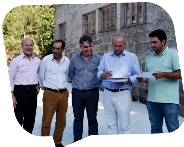
Receção provisória da empreitada Execução de Pontão na Rua dos Moinhos em Valoura