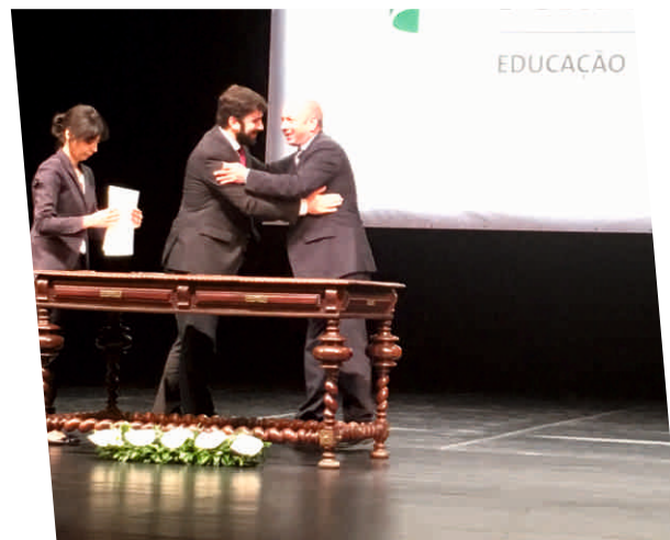
Município e Ministério da Educação com Acordo de Colaboração para a Requalificação e Modernização das Instalações da Escola Básica e Secundária de Vila Pouca de Aguiar