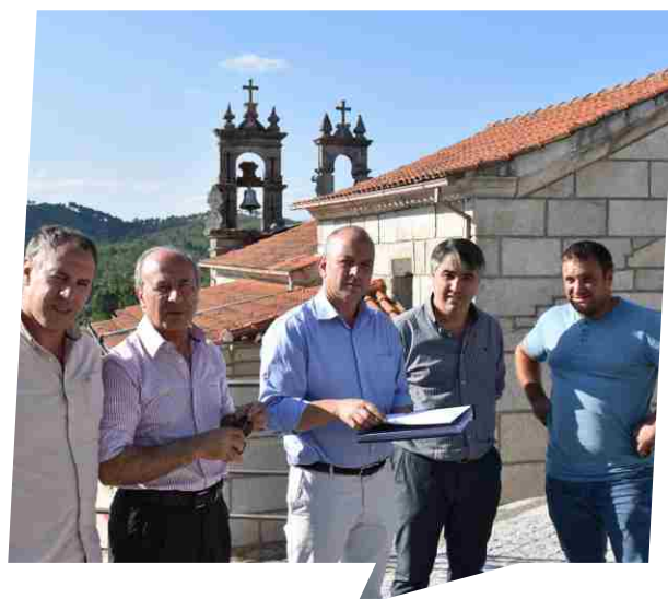
Consignação da empreitada Requalificação da Envoltura da Capela de Vila do Conde