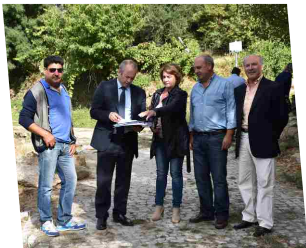
Consignação da empreitada Reconstrução de Muro de Suporte e de Pavimentos na Rua da Fonte em Nuzedo