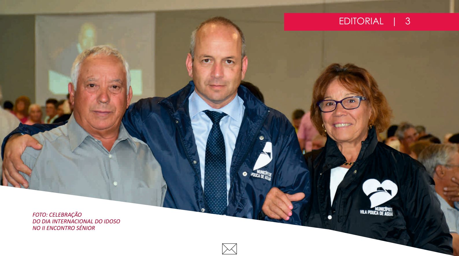
FOTO: CELEBRAÇÃO DO DIA INTERNACIONAL DO IDOSO NO II ENCONTRO SÊNIOR