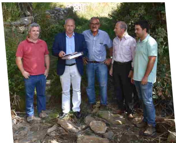
Consignação da empreitada Acesso ao Ponto de Água da Barragem do Pinhão