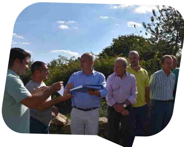
Consignação da empreitada Execução de Travessia sobre o Rio Tinhela no Caminho da Sainça em Tinhela de Baixo