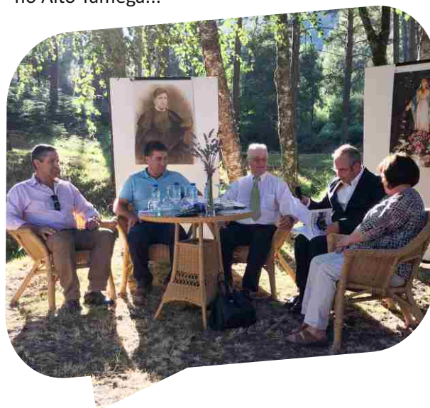
Apresentação do livro Agradecer decorreu no verão na freguesia de Telões