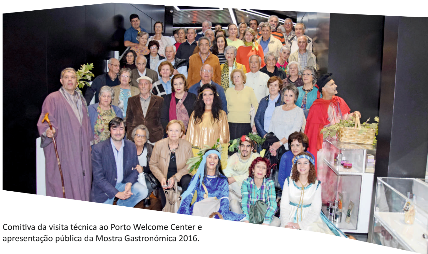
Comitiva da visita técnica ao Porto Welcome Center e apresentação pública da Mostra Gastronómica 2016.