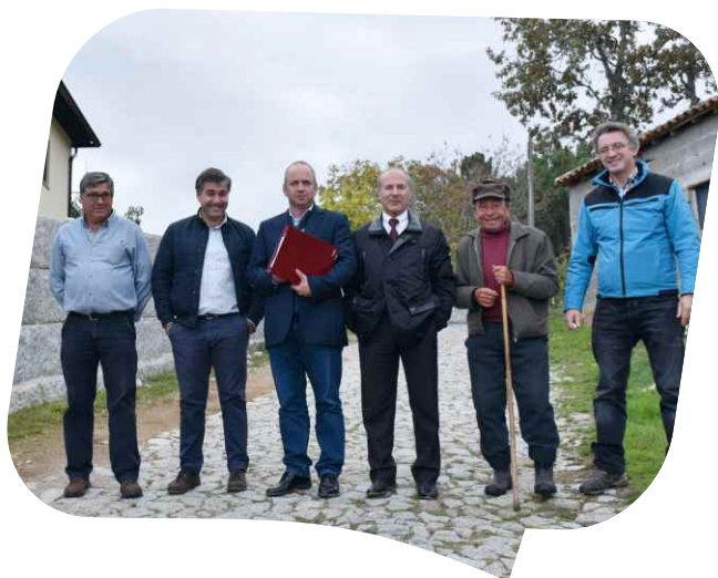
Consignação de Pavimentação em Outeiro