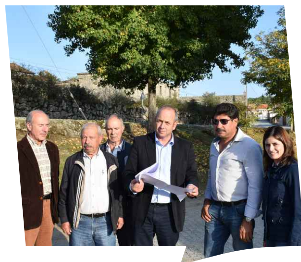
Início de Requalificação do Largo Principal da Freixeda