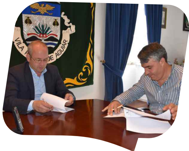
Protocolo de cooperação financeira e técnica entre o Município e a Junta de Freguesia de Valoura (em Vila do Conde, execução de muro na rua Central e muro de acesso ao polidesportivo).