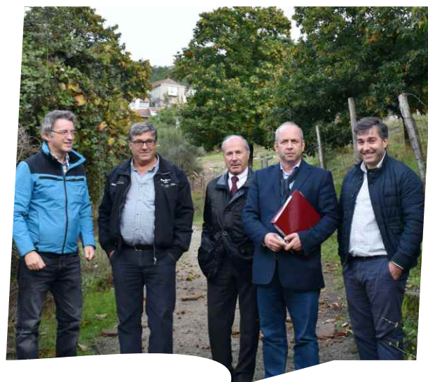
Consignação de Pavimentação em Zimão