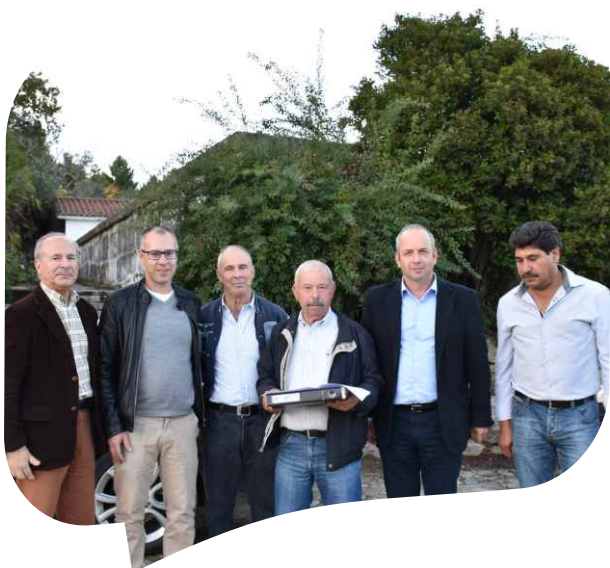
Empreitada Requalificação de Acesso ao Cemitério de Capeludos