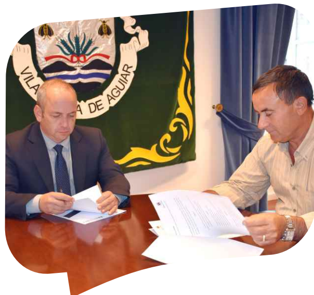
Protocolo de cooperação financeira e técnica entre Município e Junta de Freguesia de Alvão (alargamento da ponte no acesso a Vidoedo e pavimentação da rua do Boco em Gouvães da Serra).