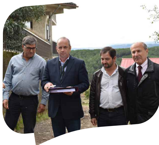
Consignação da empreitada Pavimentação da ligação de Granja a Trêsminas, em colaboração com Conselho Diretivo