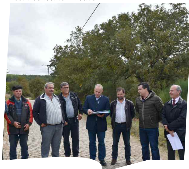
Consignação da empreitada Repavimentação da ligação de Filhagosa a Revel