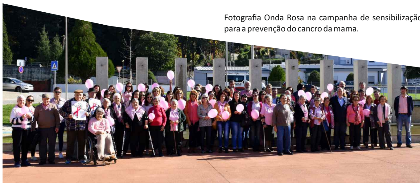
Fotografia Onda Rosa na campanha de sensibilização para a prevenção do cancro da mama.