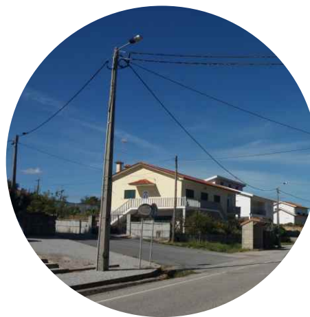
A EDP Distribuição colocou em exploração um novo posto de transformação no lugar da Carrica, freguesia de Telões, para melhorar a qualidade de serviço dos moradores