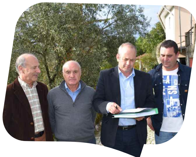
Consignação da empreitada Pavimentação da Rua do Penaçal em Carrzedo da Cabugueira