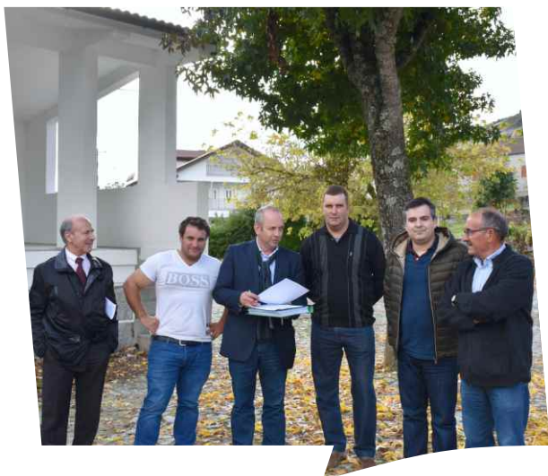
Consignação da empreitada Requalificação do Largo do Eiró em Raiz do Monte