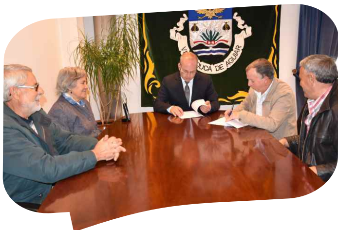
Protocolo para cedência de instalações da antiga escola primária à Associação Recreativa de Montenegro e Freiria.