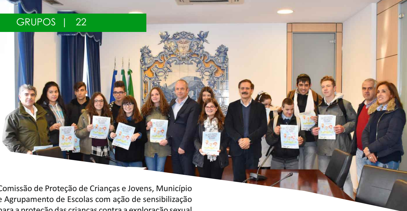
Comissão de Proteção de Crianças e Jovens, Município e Agrupamento de Escolas com ação de sensibilização para a proteção das crianças contra a exploração sexual e abuso sexual.