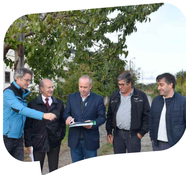
Consignação de Pavimentação em Ferreirinho