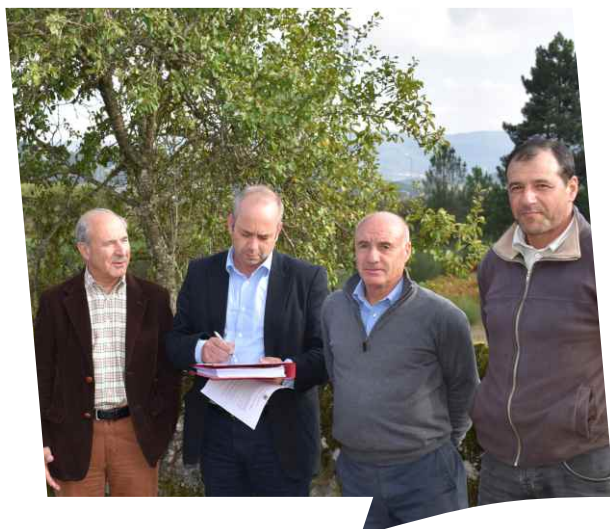
Consignação da empreitada Alargamento da Rua Central e execução de abrigo de passageiros em Bragado