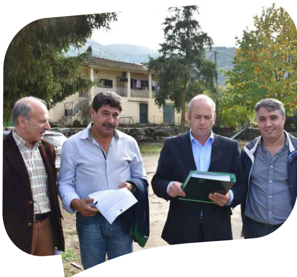
Consignação da empreitada Requalificação das envolventes da escola e da igreja em Valoura