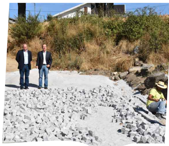
Parceria entre Câmara Municipal e Junta de Bornes de Aguiar para realização de obras na rua da Tapada em Pedras Salgadas.