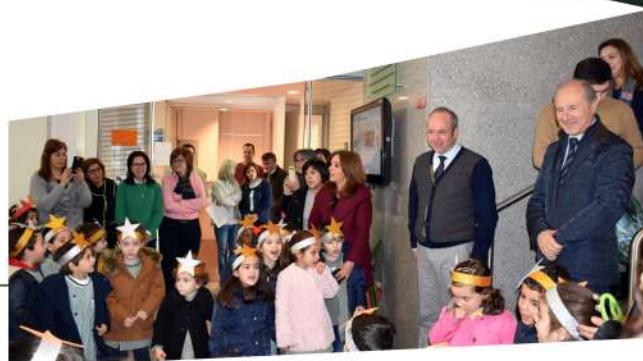
As crianças da pré-escola de Vila Pouca de Aguiar cantaram os reis ao presidente da Câmara