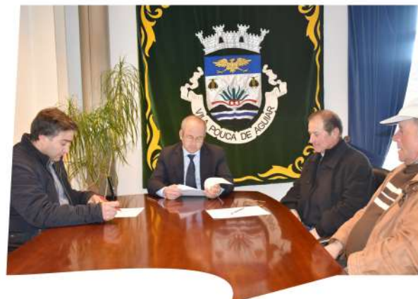
Protocolo entre Município, Junta de Freguesia de Telões e Assembleia de Compartes da Gralheira para ligação da rua da Estalagem à rua do Couto.