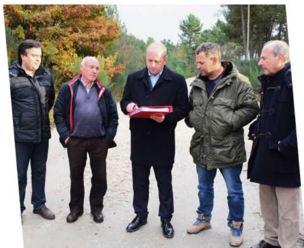
Consignação da empreitada Acesso ao ponto de água de Vilela da Cabugueira desde a EM 549