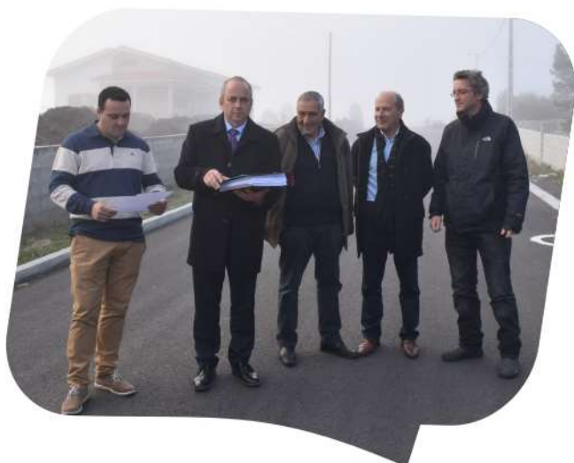
Receção Provisória da empreitada Pavimentação da Rua da Cervelha em Paredes do Alvão