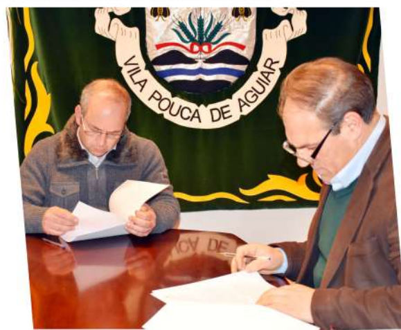
O Município e o Conselho Diretivo de Baldios de Tourencinho estabeleceram um protocolo de cooperação financeira e técnica para a execução de duas obras, a saber: repavimentação da rua do Redondo e requalificação do fontanário do Carril e zona envolvente.