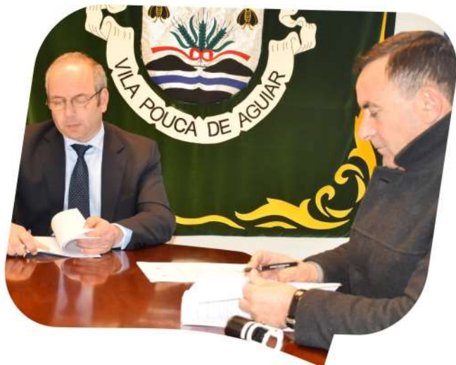
Protocolo entre Município e Junta de Freguesia do Alvão para a construção de Casa Mortuária em Paredes do Alvão.