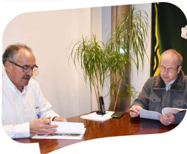
Protocolo de cooperação financeira e técnica entre Município e Junta de Freguesia de Vreia de Jales para obras de pavimentações em Rua do Candal em Campo de Jales; Rua no Bairro dos Mineiros; Travessa à Rua do Cruzeiro em Campo de Jales; Ruas Trás da Portela e Recoste em Quintã de Jales.