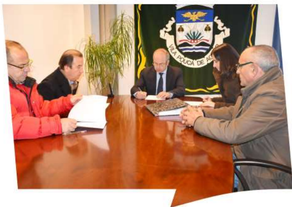
Protocolo entre Município e Conselho Diretivo dos Baldios da Lagoa e Centro Social de Santo António da Lagoa para a cedência de instalações da antiga escola primária da Lagoa às respetivas coletividades locais.