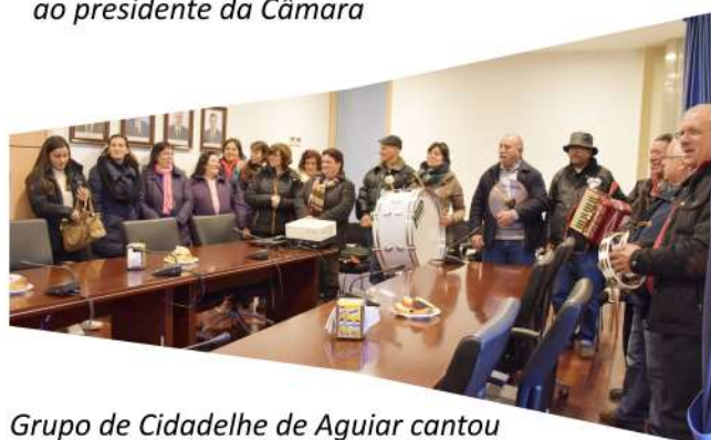
Grupo de Cidadelhe de Aguiar cantou os reis nos Paços do Concelho