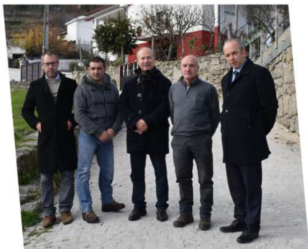
Receção Provisória da empreitada Intervenção na Rua da Escola e na Rua do Vale da Joga no Bragado