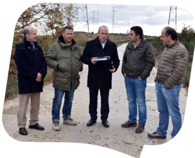
Consignação da empreitada Reabilitação do Estradão da Falperra