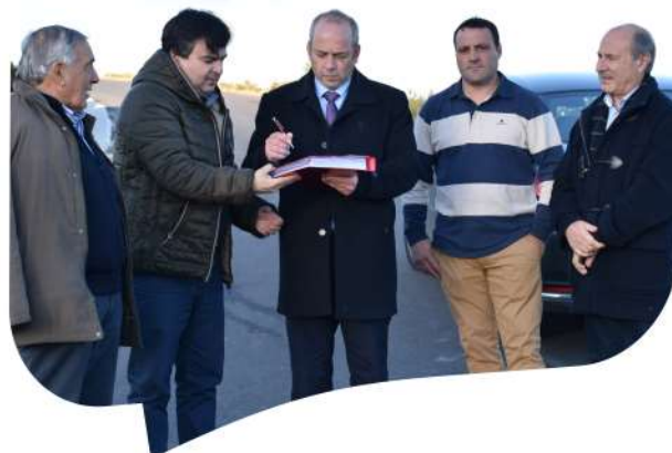
Receção Provisória da empreitada Pavimentação da ligação de Gouvães ao Pinduradouro