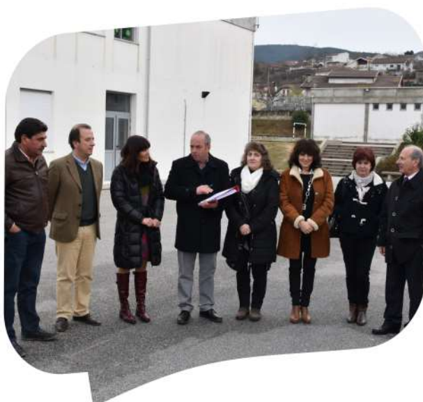
Consignação de Execução de uma cobertura exterior na escola EB 1-2 de Pedras Salgadas