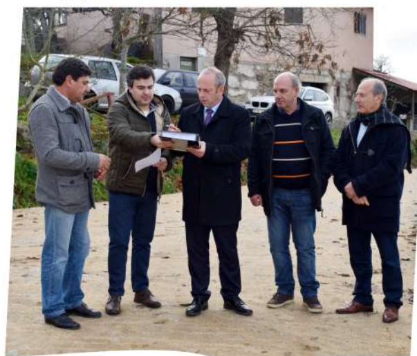
Receção Provisória da empreitada Reconstrução de muro de suporte e de pavimentos na Rua da Fonte em Nozede