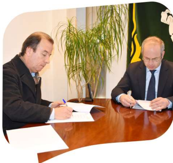
Protocolo entre Município e Junta de Freguesia de Bornes de Aguiar para a execução das seguintes obras: arranjo urbanístico na rua do Outeiro na Lagoa; pavimentação do caminho de ligação de Lagobom às Romanas; pavimentação da rua Boca dos Lameiros em Pedras Salgadas.