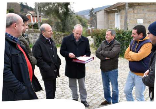
Consignação da empreitada Requalificação do largo principal de Nozede