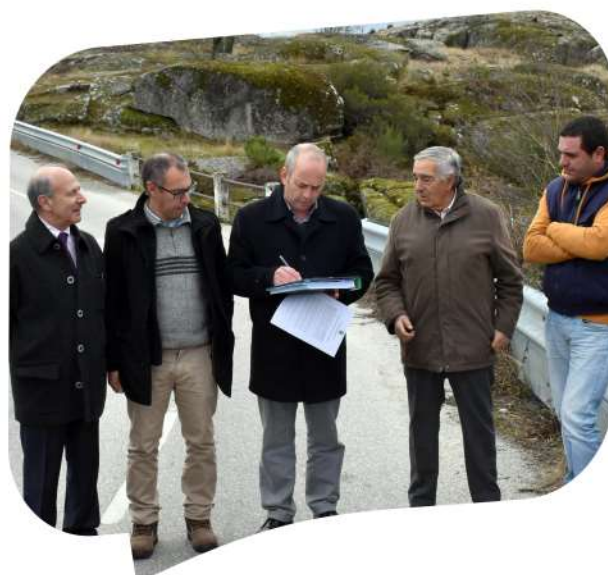
Consignação da empreitada Alargamento da ponte no CM 1174 ,Viduedo, Alvão