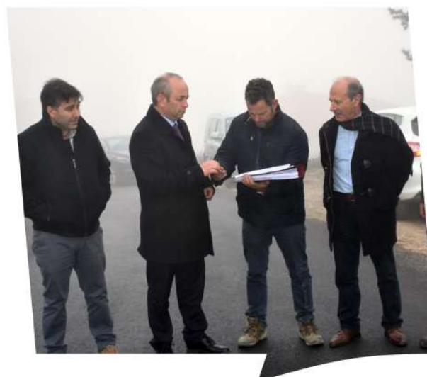
Receção Provisória da empreitada Vale de Aguiar - Requalificação da Aldeia Histórica em Castelo