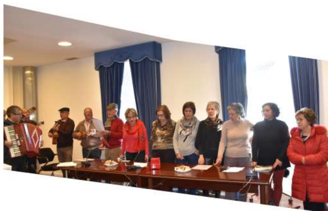
Elementos da Universidade Sénior das Terras de Aguiar deslocaram-se aos Paços do Concelho para Cantar os Reis ao executivo e aos funcionários municipais