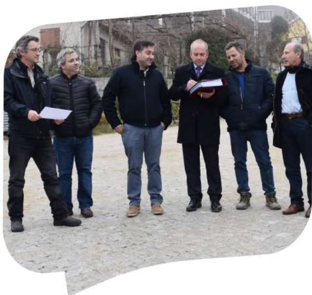
Receção Provisória da empreitada Vale de Aguiar - Requalificação da Aldeia Histórica em Pontido