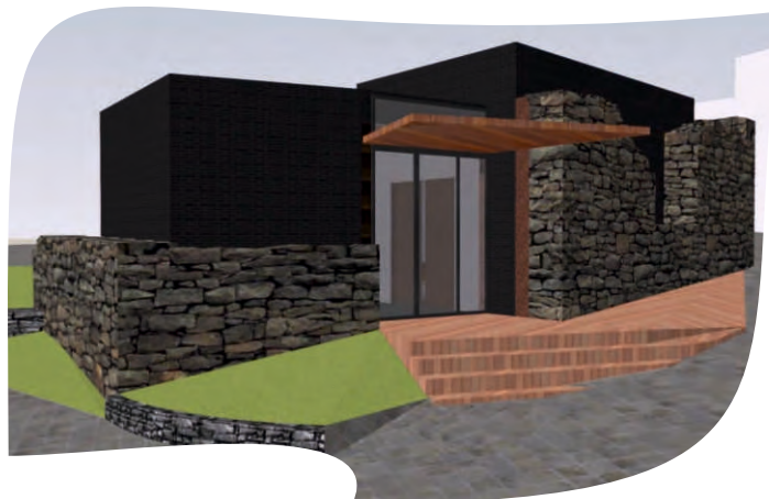
MORTUÁRIA DE BALUGAS