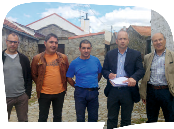
CONSIGNAÇÃO DA EMPREITADA REPAVIMENTAÇÃO DA RUA DO SAPATEIRO EM ALFARELA DE JALES