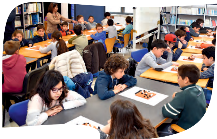
FINAL DO VII TORNEIO DE TABULEIROS ROMANOS NA BIBLIOTECA MUNICIPAL