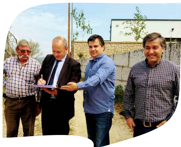
CONSIGNAÇÃO DA EMPREITADA PAVIMENTAÇÃO DO CAMINHO CHÃO DA CABEÇA EM ZIMÃO