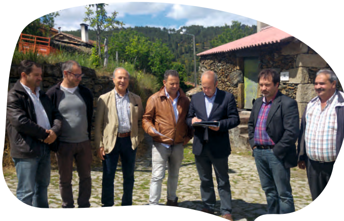
CONSIGNAÇÃO DA EMPREITADA CONCLUSÃO DOS SUBSISTEMAS DE DRENAGEM DE ÁGUAS RESIDUAIS - LOTE 12 - VILARELHO