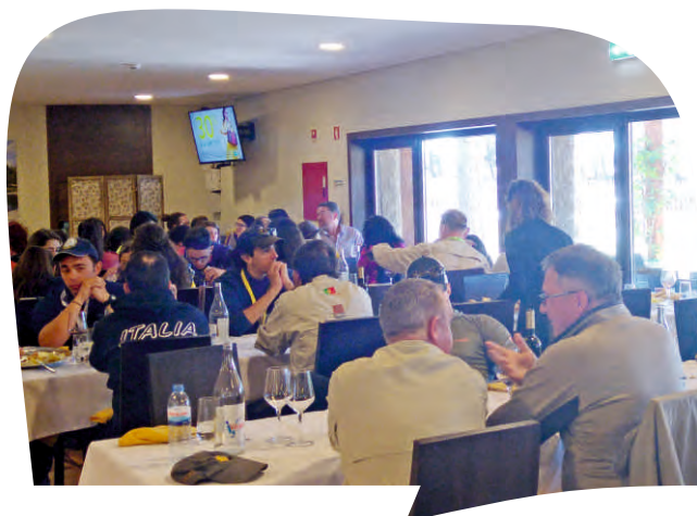
LAGOA DO ALVÃO FOI UM DOS LOCAIS ONDE DECORREU O CAMPEONATO DA EUROPA DE PESCA À PLUMA, EM QUE PARTICIPARAM ATLETAS DE 12 PAÍSES