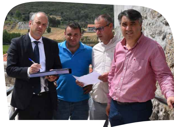
RECEÇÃO PROVISÓRIA DA EMPREITADA REQUALIFICAÇÃO DA ENVOLVENTE DA CAPELA DE VILA DO CONDE