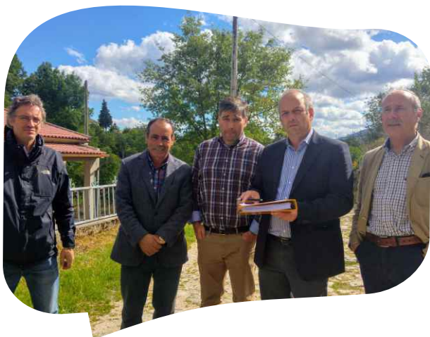
CONSIGNAÇÃO DA EMPREITADA REPARAÇÃO DO CAMINHO DAS FONTAINHAS EM VILA CHÃ