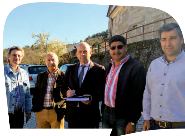
CONSIGNAÇÃO DA EMPREITADA REQUALIFICAÇÃO DO LARGO DE ZIMÃO