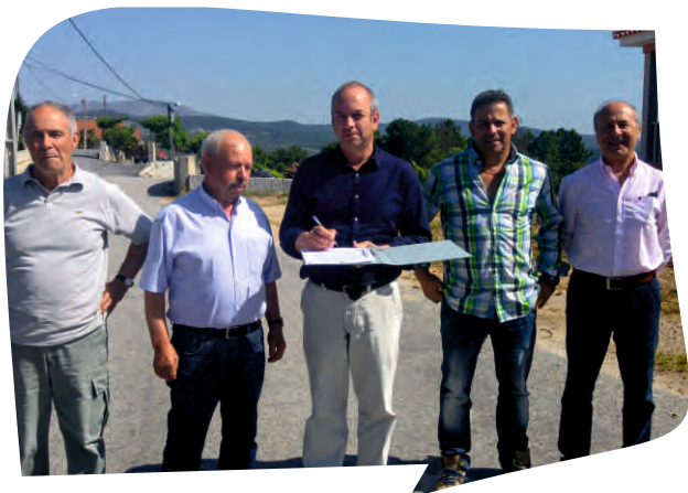
CONSIGNAÇÃO DA EMPREITADA CONCLUSÃO DOS SUBSISTEMAS DE DRENAGEM DE ÁGUAS RESIDUAIS - LOTE 3 - CAPELUDOS DE AGUIAR