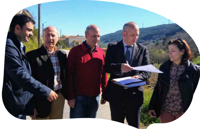
CONSIGNAÇÃO DA EMPREITADA MURO NA RUA RIBEIRO CHACIM, VILA POUCA DE AGUIAR