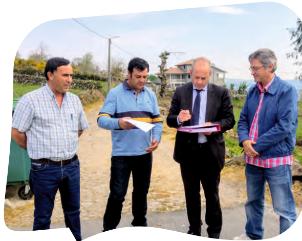
CONSIGNAÇÃO DA EMPREITADA INTERVENÇÃO NO CAMINHO DO PLAME E DAS POÇAS EM REBORDOCHÃO