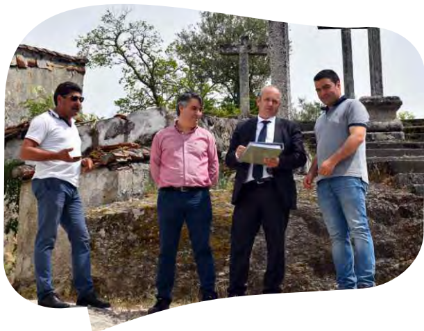
CONSIGNAÇÃO DA EMPREITADA REQUALIFICAÇÃO DO CALVÁRIO EM VILA DO CONDE