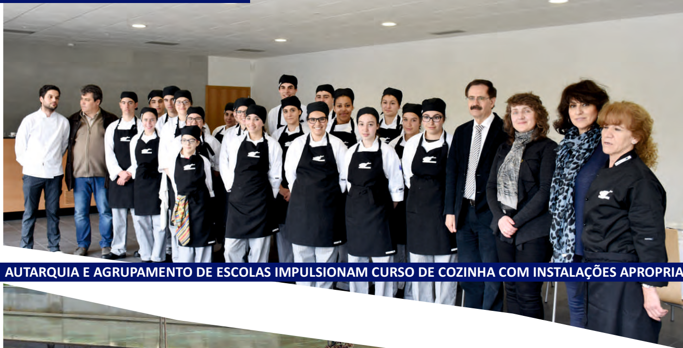
AUTARQUIA E AGRUPAMENTO DE ESCOLAS IMPULSIONAM CURSO DE COZINHA COM INSTALAÇÕES APROPRIADAS