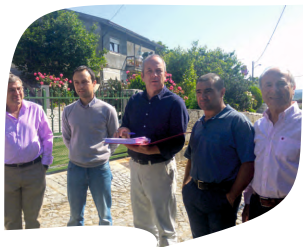
CONSIGNAÇÃO DA EMPREITADA REPARAÇÃO DE ÁGUAS PLUVIAIS NA RUA DAS HORTINHAS EM SABROSO DE AGUIAR