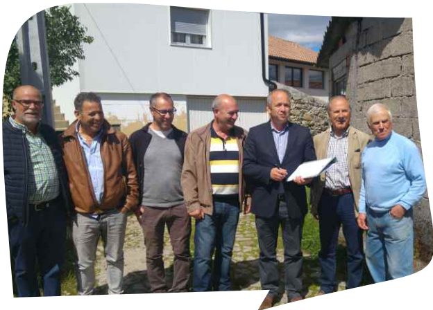
CONSIGNAÇÃO DA EMPREITADA CONCLUSÃO DOS SUBSISTEMAS DE DRENAGEM DE ÁGUAS RESIDUAIS - LOTE 6 - GUILHADO