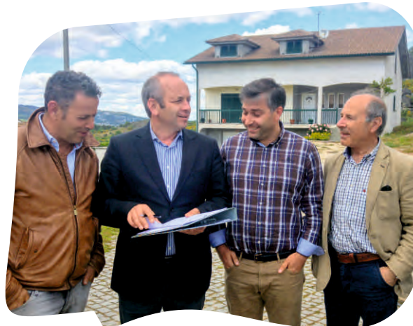
CONSIGNAÇÃO DA EMPREITADA CONCLUSÃO DOS SUBSISTEMAS DE DRENAGEM DE ÁGUAS RESIDUAIS - LOTE 10 - TOURENCINHO