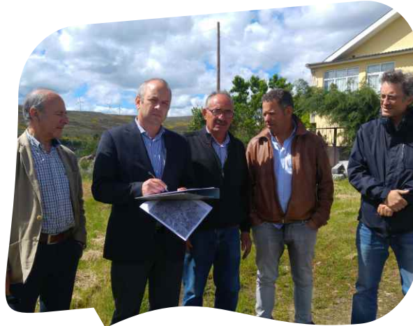
CONSIGNAÇÃO DA EMPREITADA CONCLUSÃO DOS SUBSISTEMAS DE DRENAGEM DE ÁGUAS RESIDUAIS - LOTE 7 - QUINTÀ DE JALES