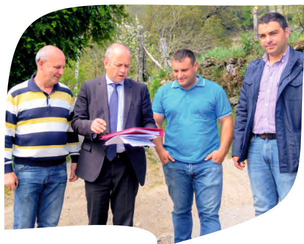
CONSIGNAÇÃO DA EMPREITADA PAVIMENTAÇÃO DO CAMINHO DO CONDADO EM VILA POUCA DE AGUIAR