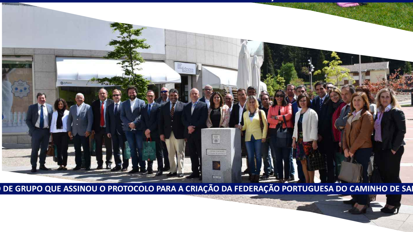
FOTO DE GRUPO QUE ASSINOU O PROTOCOLO PARA A CRIAÇÃO DA FEDERAÇÃO PORTUGUESA DO CAMINHO DE SANTIAGO