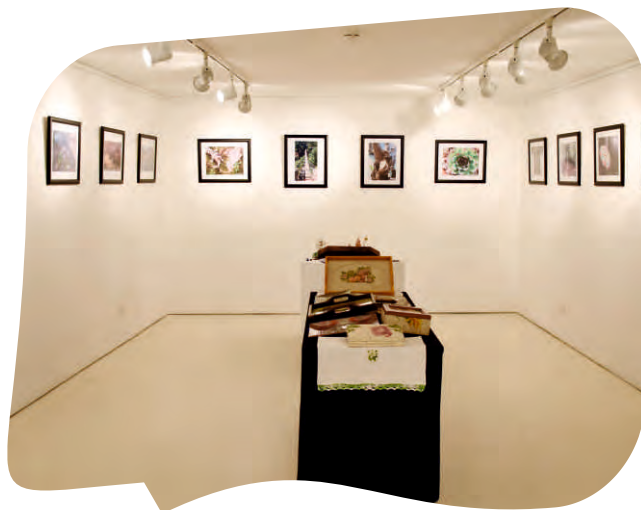
EXPOSIÇÃO NO MUSEU MUNICIPAL O NOSSO OLHAR FOI PROMOVIDA POR PESSOAS QUE INTEGRAM A UNIVERSIDADE SÉNIOR DAS TERRAS DE AGUIAR