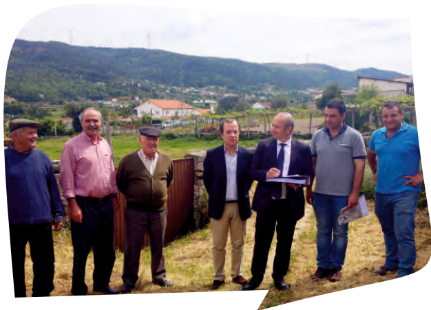
CONSIGNAÇÃO DA EMPREITADA INTERVENÇÃO NO CAMINHO DO PLAME E DAS POÇAS EM REBORDOCHÃO