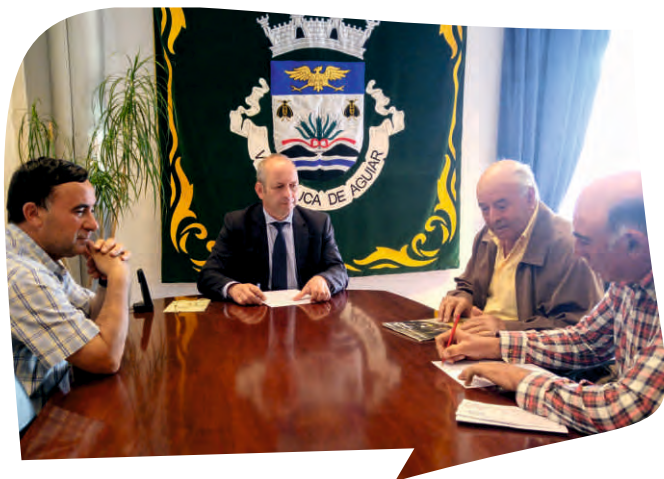
ASSINATURA DE PROTOCOLO COM CONSELHO DIRETIVO DE BALDIOS DE AFONSIM PARA REPARAÇÃO DO CAMINHO QUE LIGA AFONSIM AO MINHÉU