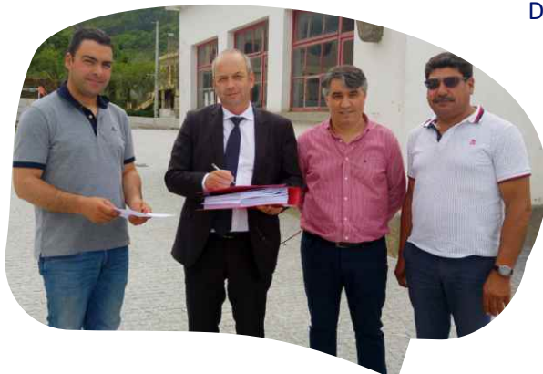
RECEÇÃO PROVISÓRIA DA EMPREITADA REQUALIFICAÇÃO DAS ENVOLVENTES DA ESCOLA E DA IGREJA EM VALOURA