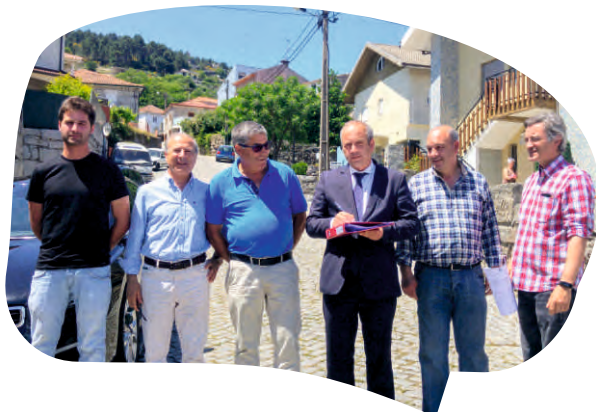
CONSIGNAÇÃO DA EMPREITADA REQUALIFICAÇÃO URBANÍSTICA DO BAIRRO DO CASTANHEIRO REDONDO