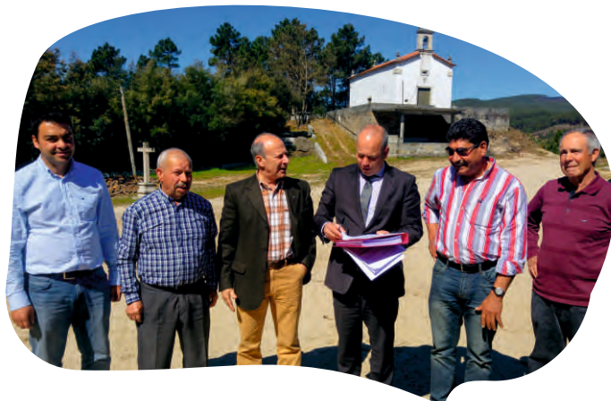
CONSIGNAÇÃO DA EMPREITADA PAVIMENTAÇÃO DE ACESSOS AO SANTUÁRIO DE NOSSA SENHORA DA CONCEIÇÃO EM CAPELUDOS DE AGUIAR