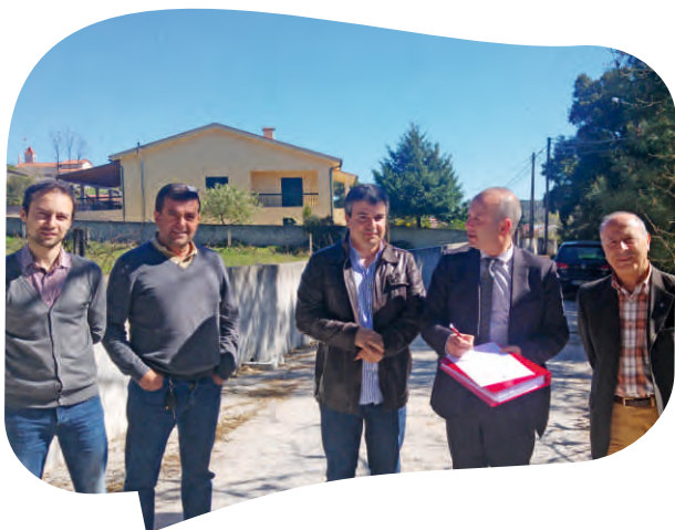
RECEÇÃO PROVISÓRIA DA EMPREITADA ALARGAMENTO DA RUA DO CORDALUZ EM SABROSO DE AGUIAR