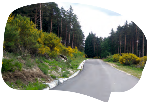
LIGAÇÃO DO PLANALTO DO ALVÃO AO VALE DE AGUIAR