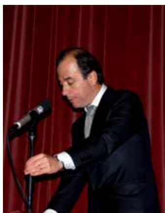
Bornes de Aguiar