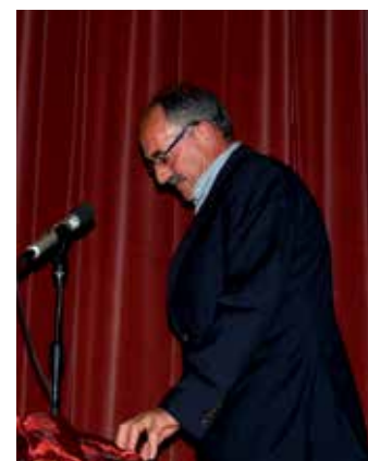
Vreia de Jales