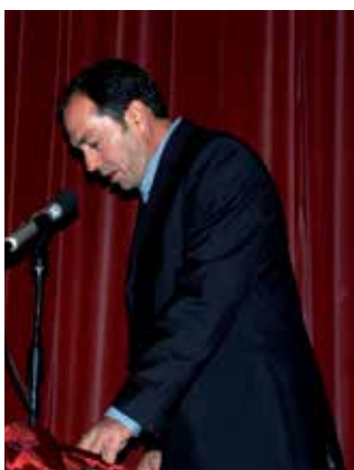
Vreia de Bornes