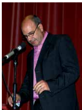
Vila Pouca de Aguiar