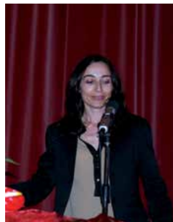
Pensalvos e Parada de Monteiros