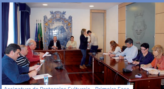
Assinatura de Protocolos Culturais - Primeira Fase