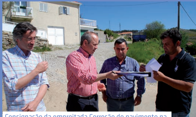
Consignação da empreitada Correção do pavimento na Rua Central em Pinduradouro