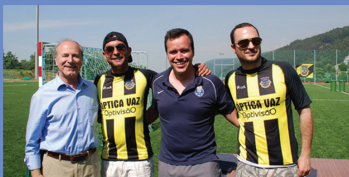
SC Vila Pouca impulsionou encontro de traquinas no Complexo Desportivo