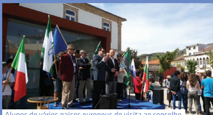
Alunos de vários países europeus de visita ao concelho