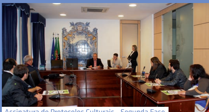
Assinatura de Protocolos Culturais - Segunda Fase