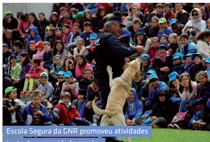
Escola Segura da GNR promoveu atividades junto da comunidade escolar