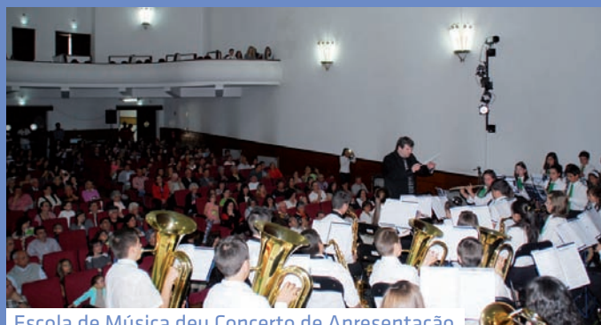
Escola de Música deu Concerto de Apresentação