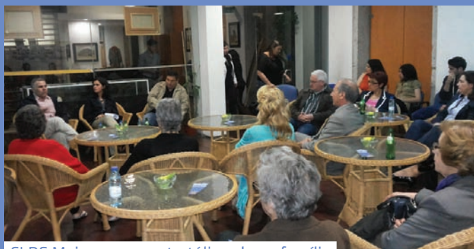
CLDS Mais promoveu tertúlia sobre a família