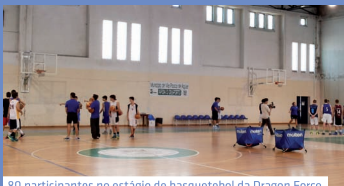
80 participantes no estágio de basquetebol da Dragon Force