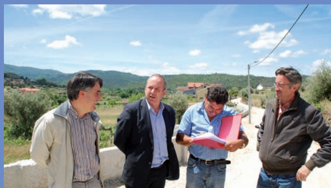
Receção provisória de muro na rua da Silveira em Vila do Conde