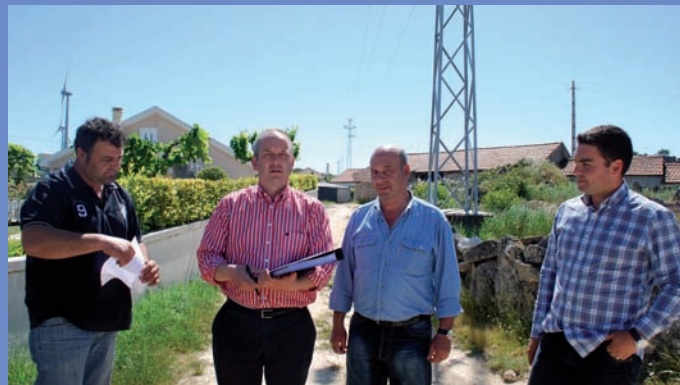
Consignação da empreitada Pavimentação da Travessa das Vessadas em Guilhado