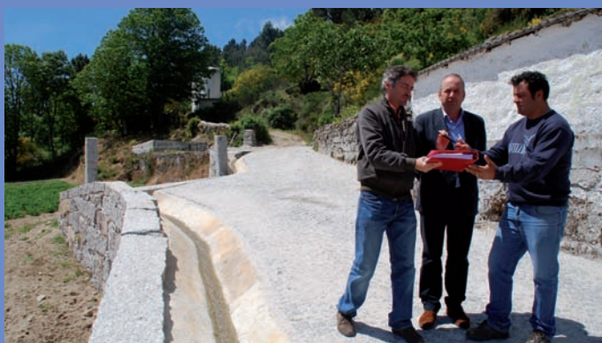
Receção provisória de muro no acesso a reservatório de água de Castanheiro Redondo