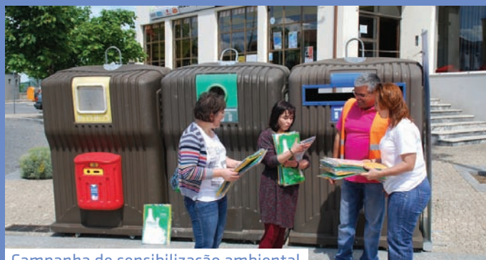
Campanha de sensibilização ambiental