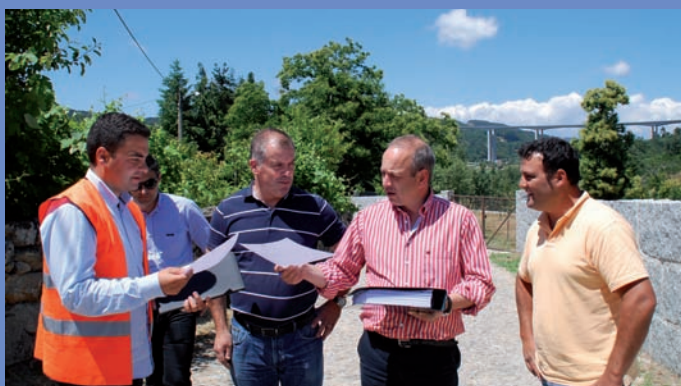
Consignação da empreitada Saneamento e Água na Rua dos Fojos em Parada de Aguiar