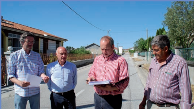
Consignação da empreitada Execução de passeios na localidade de Vilela da Cabugueira