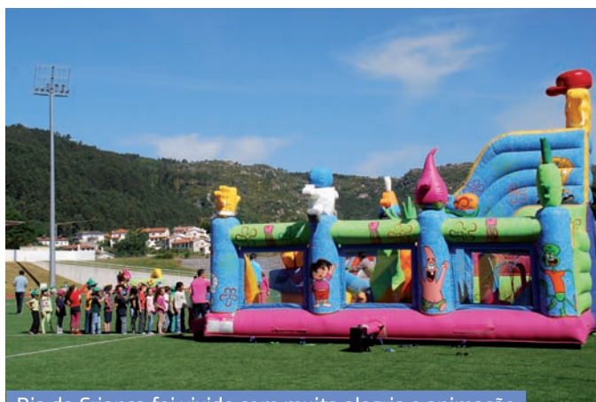
Dia da Criança foi vivido com muita alegria e animação

Áreas como acessibilidades, serviços comuns e ambiente integram propostas para implementar os planos de pormenor relativos às três áreas de exploração de granito.