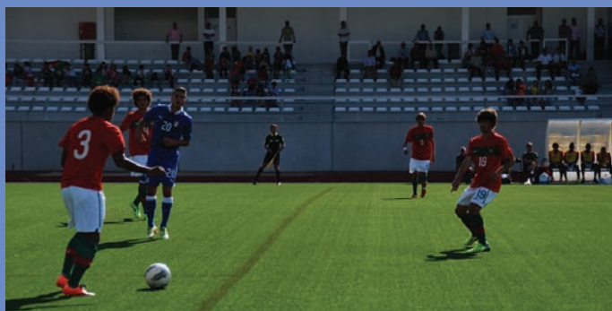
Torneio UEFA trouxe seleção nacional ao Complexo Desportivo