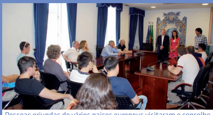
Pessoas oriundas de vários países europeus visitaram o concelho