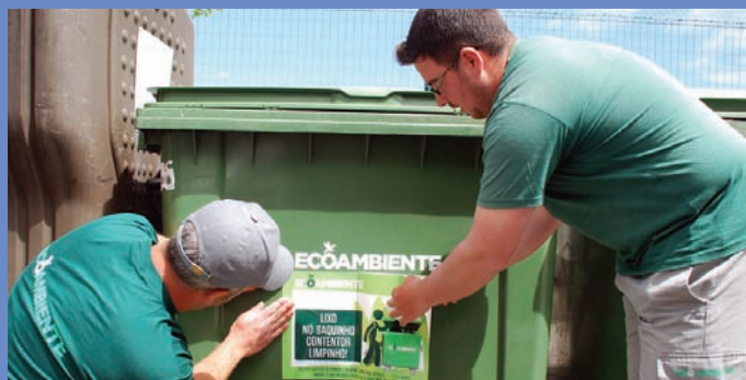
Sensibilização para uma correta colocação de resíduos nos contentores