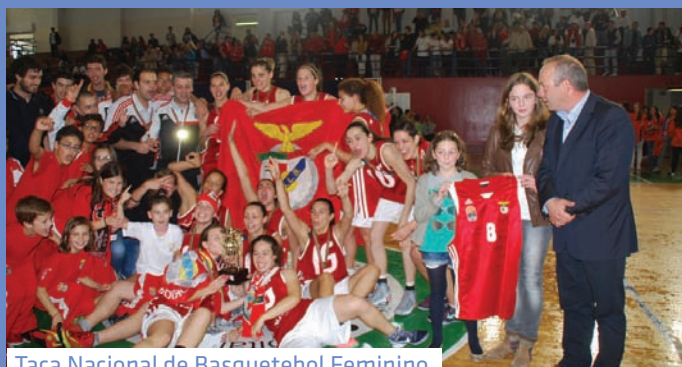
Taça Nacional de Basquetebol Feminino