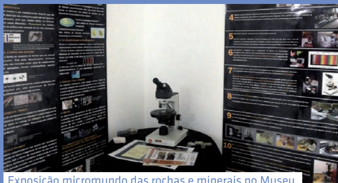
Exposição micromundo das rochas e minerais no Museu