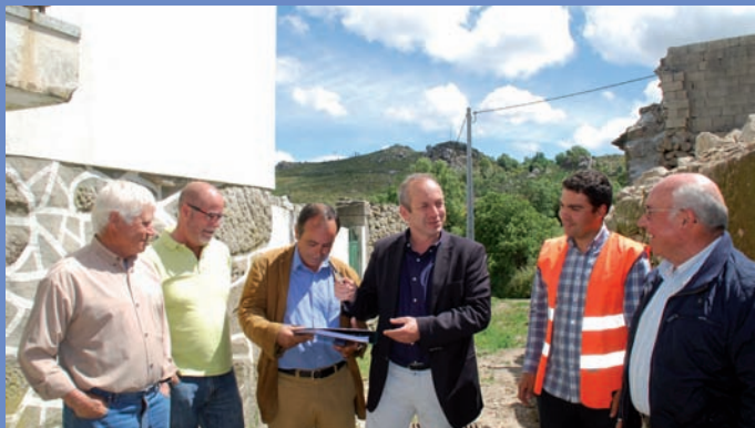
Consignação da empreitada Pavimentação da rua do Ribeirinho no acesso à ETAR de Guilhado