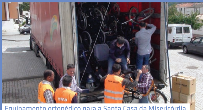
Equipamento ortopédico para a Santa Casa da Misericórdia