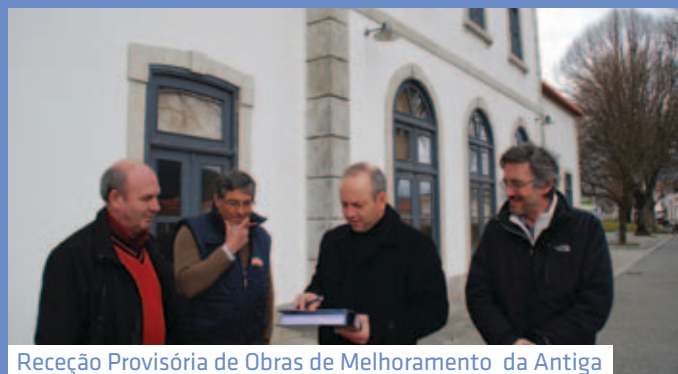
Receção Provisória de Obras de Melhoramento da Antiga Estação da CP em Vila Pouca de Aguiar