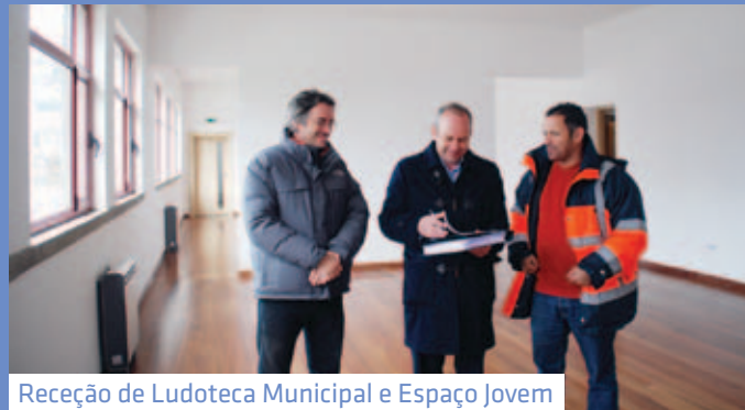
Receção de Ludoteca Municipal e Espaço Jovem