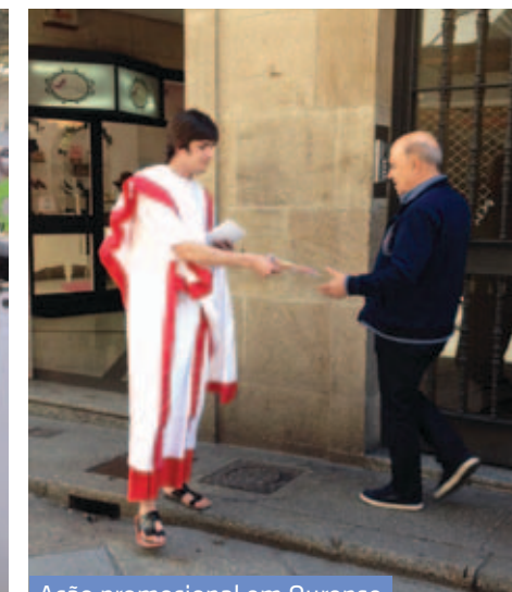
Ação promocional em Ourense