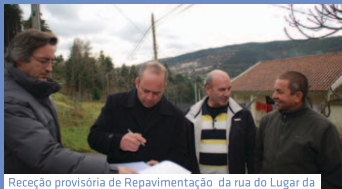
Receção provisória de Repavimentação da rua do Lugar da Quinta em Nuzedo