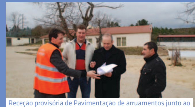
Receção provisória de Pavimentação de arruamentos junto ao lugar da feira em Campo de Jales