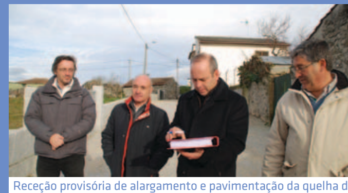
Receção provisória de alargamento e pavimentação da quelha da Ribeira em Vilela da Cabugueira