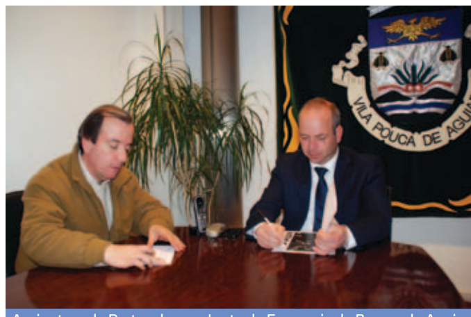
Assinatura de Protocolo com Junta de Freguesia de Bornes de Aguiar