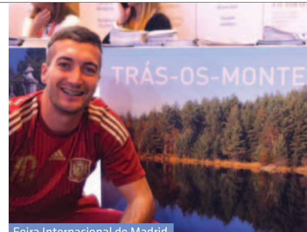
Feira Internacional de Madrid