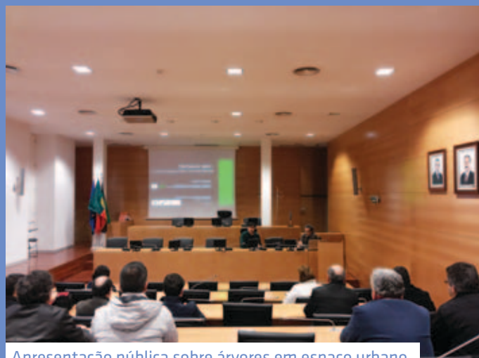
Apresentação pública sobre árvores em espaço urbano