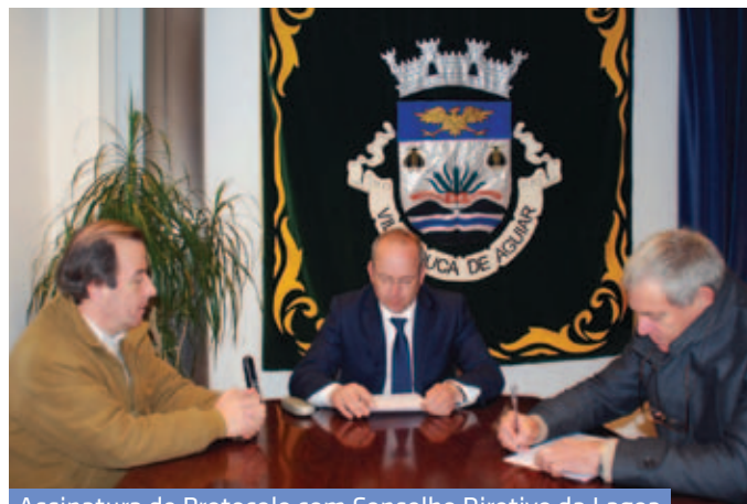
Assinatura de Protocolo com Conselho Diretivo da Lagoa