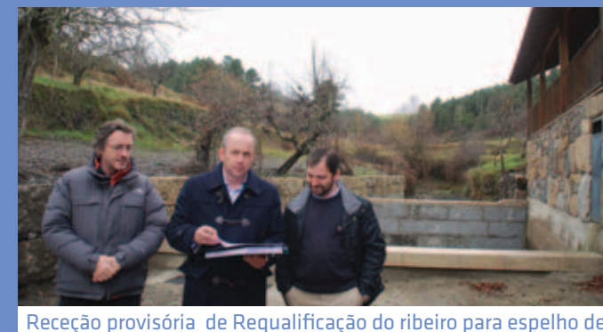
Receção provisória de Requalificação do ribeiro para espelho de água - P.I. Trêsmas