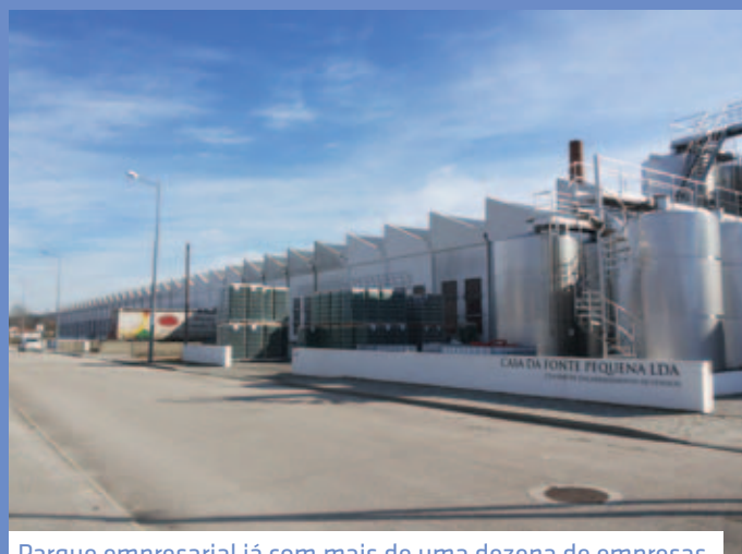
Parque empresarial já com mais de uma dezena de empresas