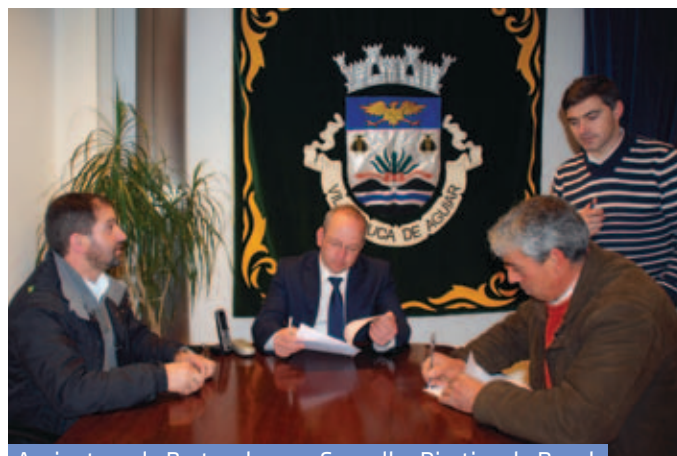
Assinatura de Protocolo com Conselho Diretivo de Revel