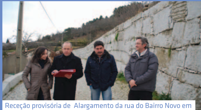
Receção provisória de Alargamento da rua do Bairro Novo em Soutelo de Matos