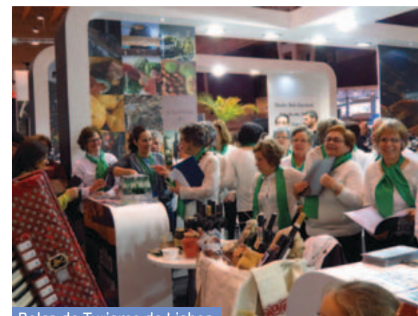
Bolsa de Turismo de Lisboa