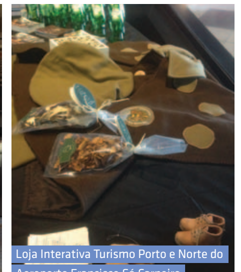
Loja Interativa Turismo Porto e Norte do Aeroporto Francisco Sá Carneiro