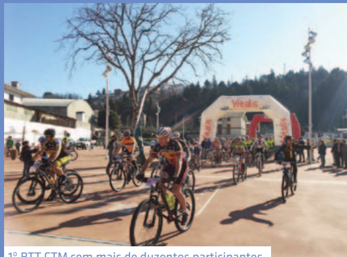
1º BTT CTM com mais de duzentos participantes