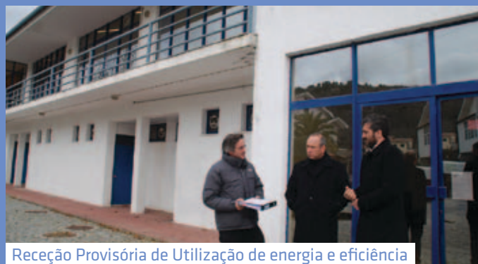
Receção Provisória de Utilização de energia e eficiência energética em Gimnodesportivo