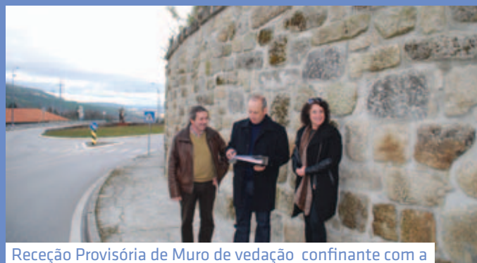
Receção Provisória de Muro de vedação confinante com a variante Nascente