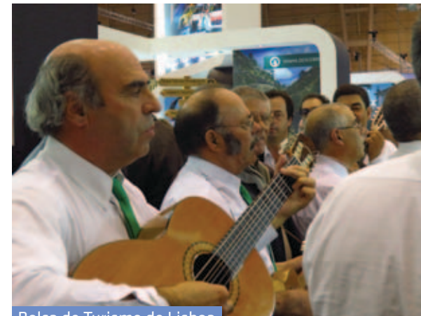
Bolsa de Turismo de Lisboa