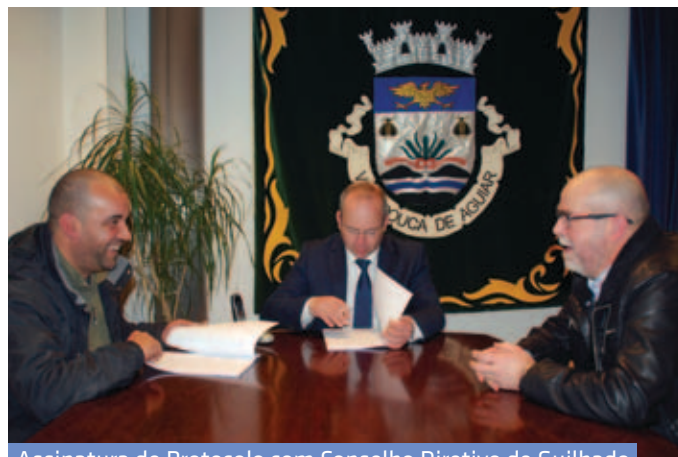
Assinatura de Protocolo com Conselho Diretivo de Guilhado