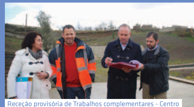
Receção provisória de Trabalhos complementares - Centro Interpretativo Polo I - Trêsmas