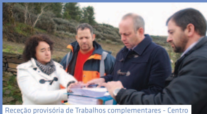
Receção provisória de Trabalhos complementares - Centro Interpretativo Polo II - Trêsmas