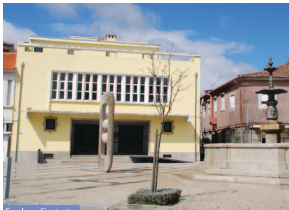
Escola no Cineteatro

A companhia de teatro vai desenvolver no concelho duas dezenas de atividades associadas à formação, desde logo, com uma sessão aberta à comunidade tornando acessível a introdução ao teatro.