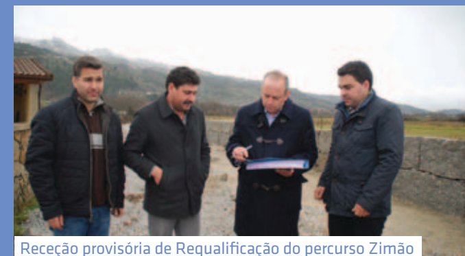
Receção provisória de Requalificação do percurso Zimão Serra da Padrela