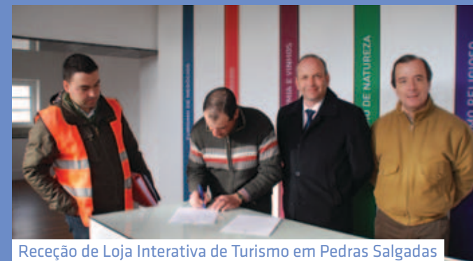
Receção de Loja Interativa de Turismo em Pedras Salgadas