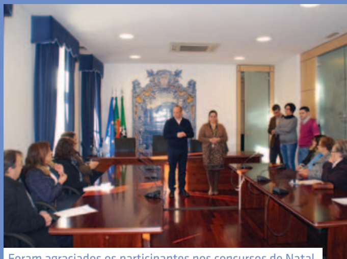
Foram agraciados os participantes nos concursos de Natal