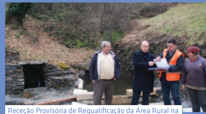
Receção Provisória de Requalificação da Área Rural na Ribeirinha - P.I. Trêsmas