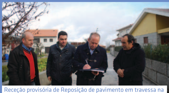
Receção provisória de Reposição de pavimento em travessa na rua Dr. Bento Acácio Pinheiro em Vila Pouca de Aguiar