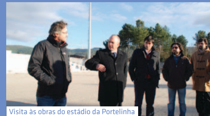
Visita às obras do estádio da Portelinha