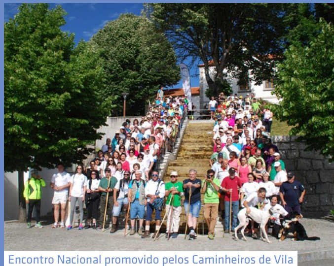
Encontro Nacional promovido pelos Caminheiros de Vila Pouca de Aguiar destacou Aldeia Rural no Alvão e Centro Hípico em Pedras Salgadas