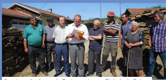
Consignação da rua do Testamento, em Tinhela de Baixo