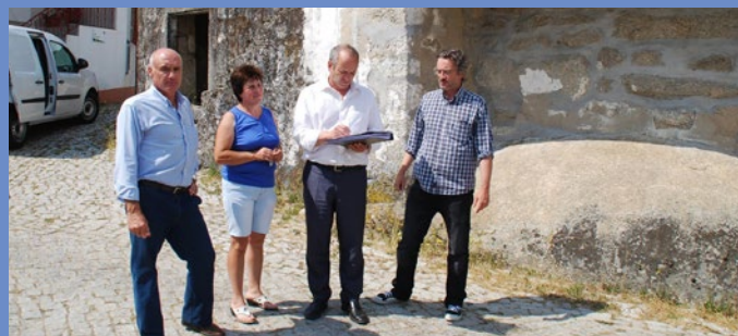
Consignação da empreitada Demolição de edificações em Carrazedo da Cabugueira