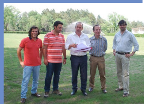
Receção de Centro Hípico - Acessos Internos, Campo de Saltos e Equipamentos