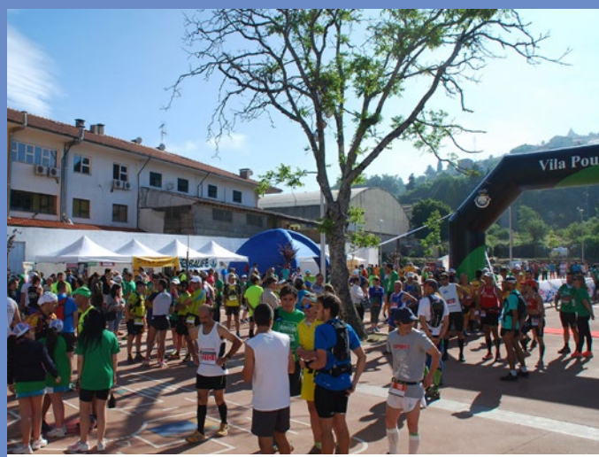
O CTM promoveu um encontro desportivo com um trail running em foco