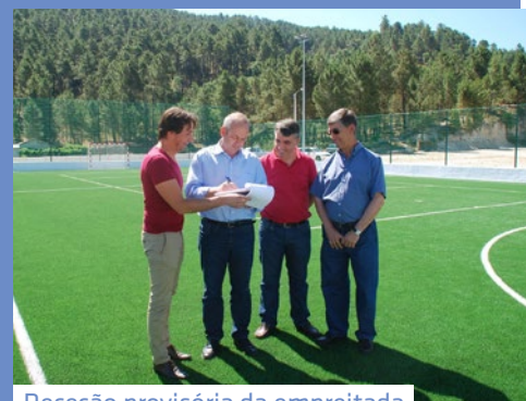
Receção provisória da empreitada Polidesportivo de Vila do Conde