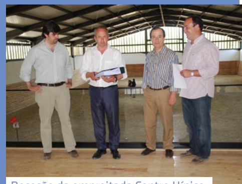
Receção da empreitada Centro Hípico