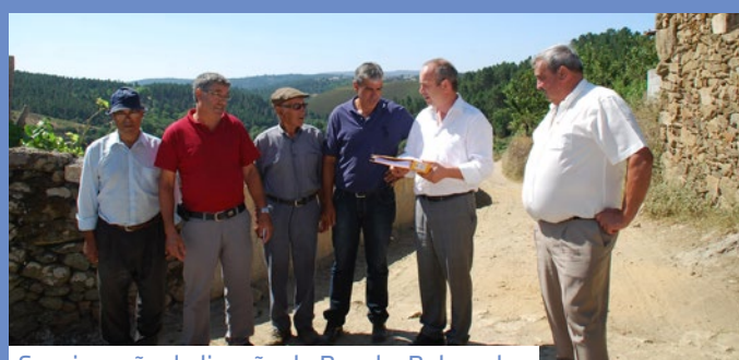
Consignação da ligação de Revel a Reboredo