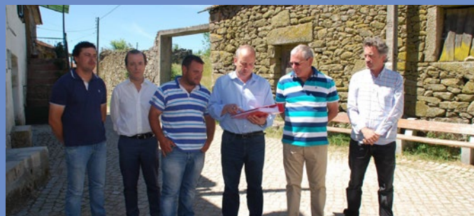
Consignação da empreitada Requalificação e alargamento da rua do Cruzeiro (Sul), em Lagoa