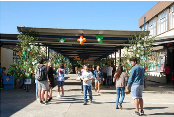
O Dia do Agrupamento de Escolas de Vila Pouca de Aguiar integrou várias atividades educativas e lúdicas