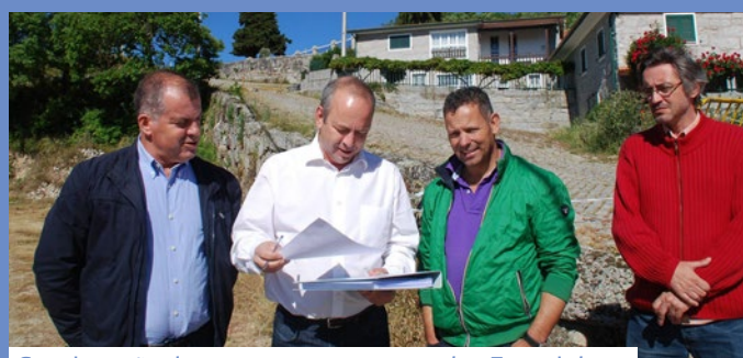
Consignação de muro no arruamento das Fontainhas, em Soutelo de Aguiar