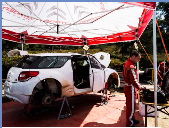
Foram vários os testes de preparação para o rali de Portugal que ocorreram no concelho aguiarense