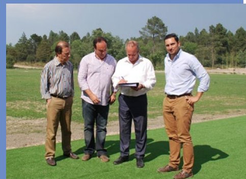
Receção da empreitada Academia de Golfe, Pedras Salgadas