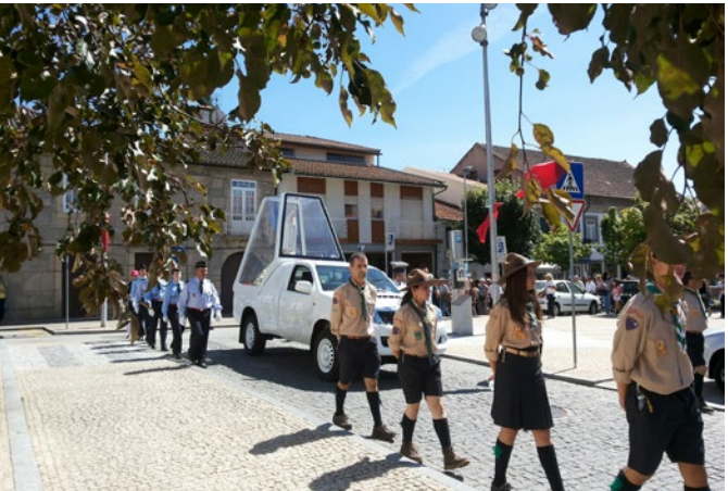
A Visita da Imagem Peregrina de Nª Sª de Fátima às Dioceses Portuguesas teve muita adesão popular no concelho