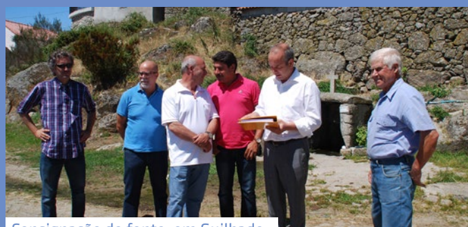
Consignação de fonte, em Guilhado