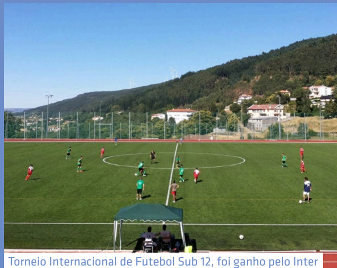
Torneio Internacional de Futebol Sub 12, foi ganho pelo Inter de Milão. O evento envolveu 300 participantes com 16 equipas. Seleção Aguiarense ficou em 5º lugar.