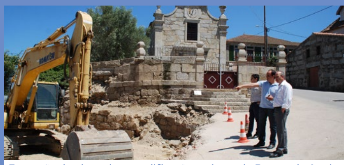
Execução de obras de requalificação no largo de Bornes de Aguiar