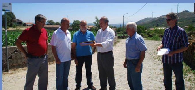
Consignação da rua do Chãozinho, em Guilhado