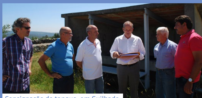
Consignação de tanque, em Guilhado