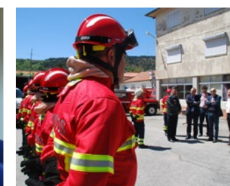
O equipamento deriva de uma candidatura ao Programa Operacional de Valorização do Território