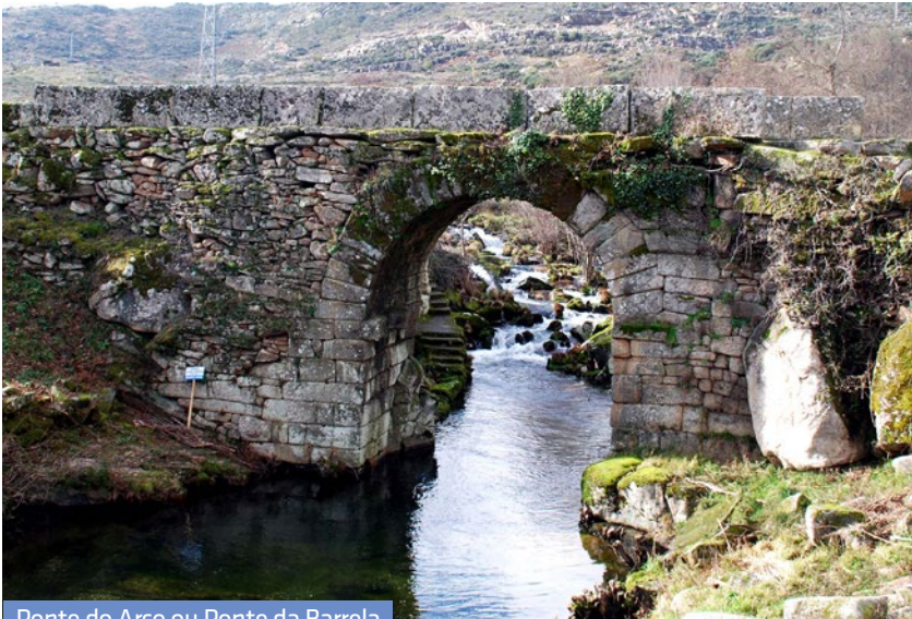
Ponte do Arco ou Ponte da Barrela

A ponte «conserva ainda todos os atributos da engenharia romana: arco com bem talhadas aduelas, paramentos interiores em pedras regulares de cantaria almofadada e pegões sabiamente assentes nos blocos de granito que marginam o rio».