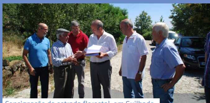
Consignação da estrada florestal, em Guilhado