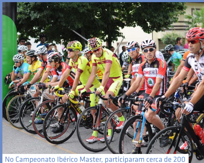
No Campeonato Ibérico Master, participaram cerca de 200 ciclistas