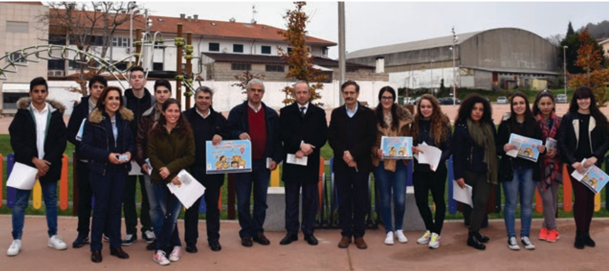
Grupo que celebrou Dia Europeu para a Proteção das Crianças contra a Exploração Sexual e Abuso Sexual, 18 de novembro