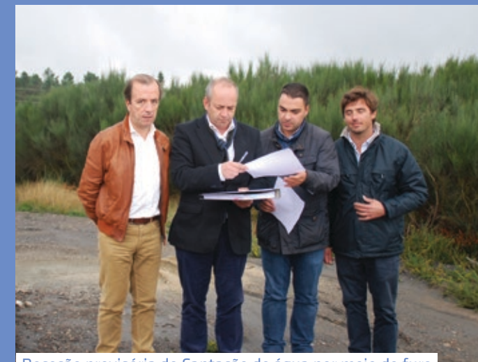
Receção provisória de Captação de água por meio de furo vertical, em Balugas