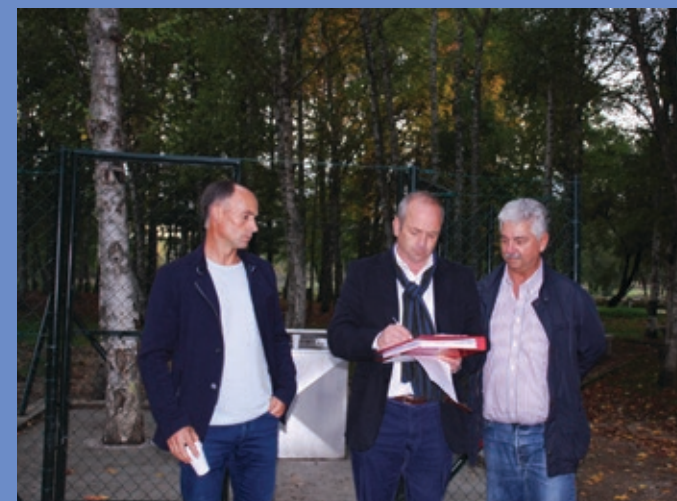
Receção provisória de Execução de vedação no furo de água mineral natural e requalificação da casa técnica no Parque de Lazer do Cardal, em Sabroso de Aguiar