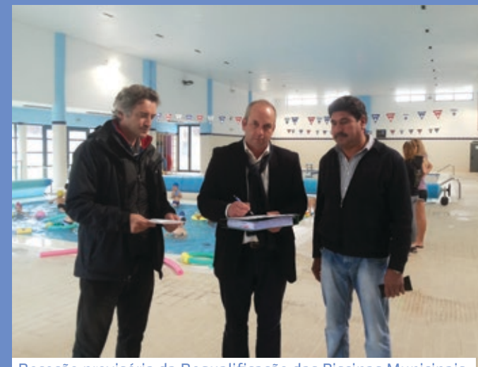
Receção provisória da Requalificação das Piscinas Municipais de Vila Pouca de Aguiar