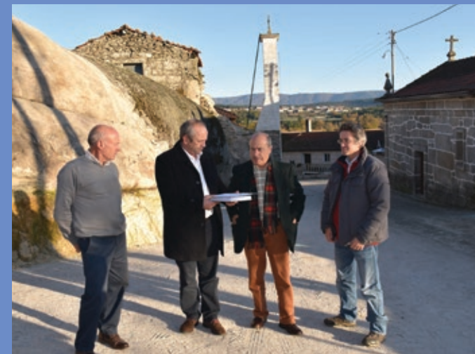
Receção provisória da empreitada Demolição de Edificações em Carrazedo da Cabugueira