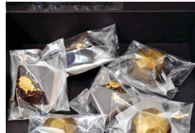
Bombom de ouro comestível, de chocolate negro com recheio de mel de urze, já disponível no Centro Interpretativo de Tresminas e na Loja Interativa de Turismo, em Pedras Salgadas