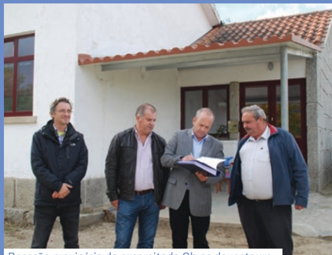
Receção provisória da empreitada Obras de restauro, conservação e valorização na Escola de Soutelo de Aguiar