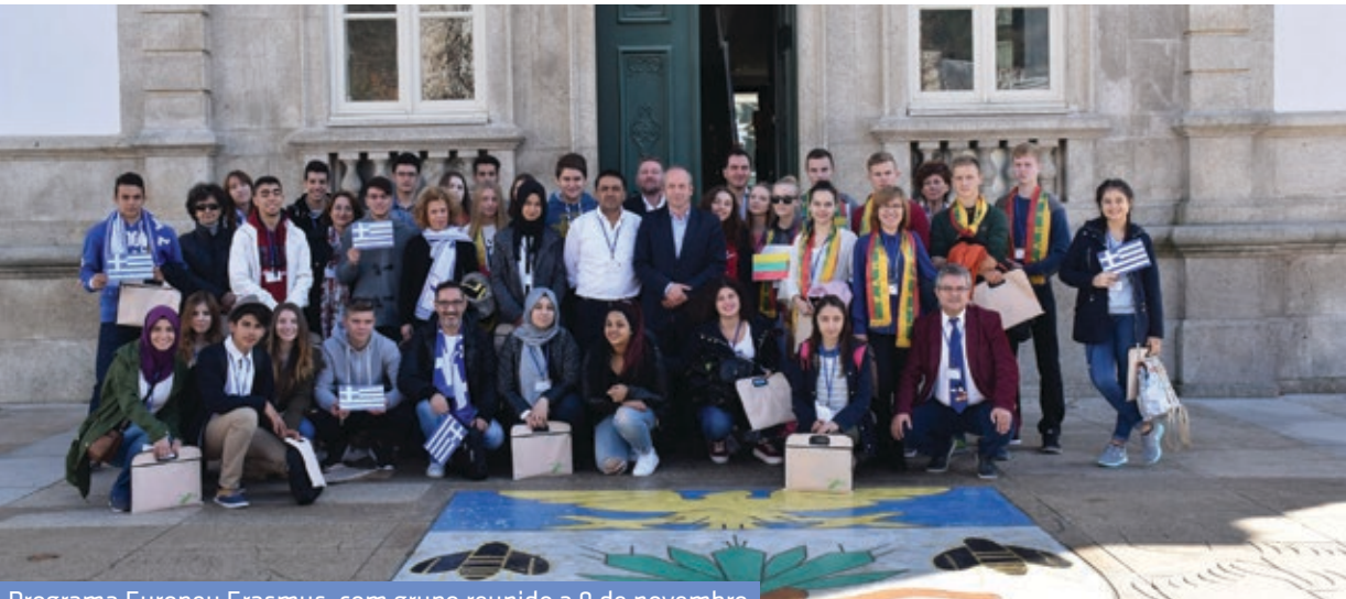
Programa Europeu Erasmus, com grupo reunido a 9 de novembro

Município de Vila Pouca de Aguiar (Geral) 259 419 100 (Linha Verde) 800 203 472 (Piquete) 966 816 120 (Proteção Civil) 961 537 535