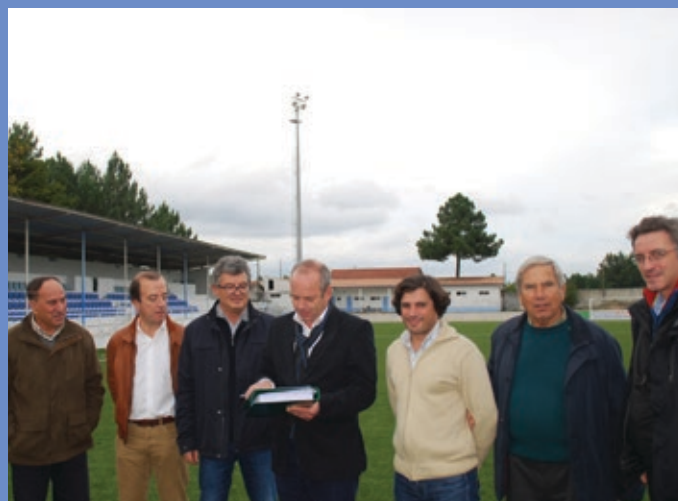
Receção provisória de Requalificação do Campo da Portelinha em Pedras Salgadas