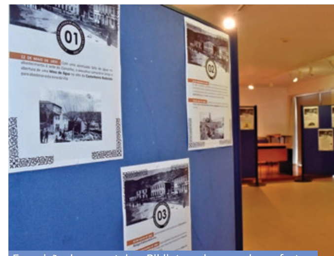
Exposição documental na Biblioteca deu a conhecer factos históricos da segunda metade do século XIX