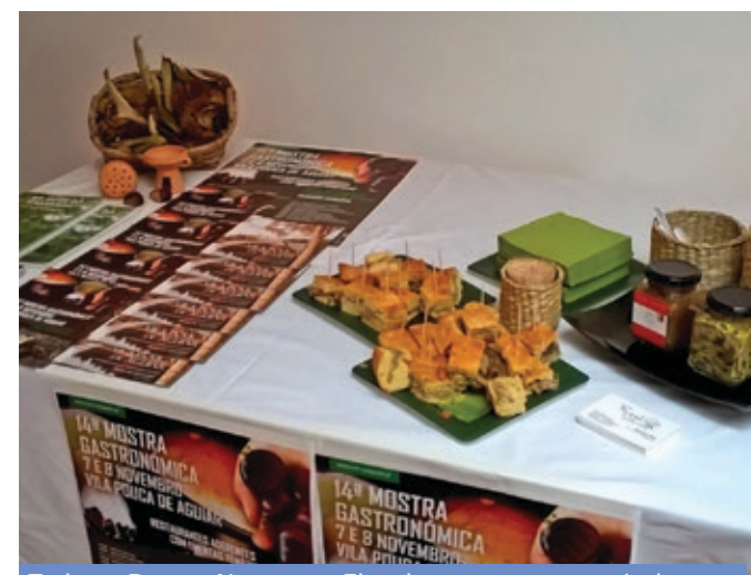
Turismo Porto e Norte com Fins de semana gastronómicos no concelho na divulgação da miscalrada e do pudim de castanha