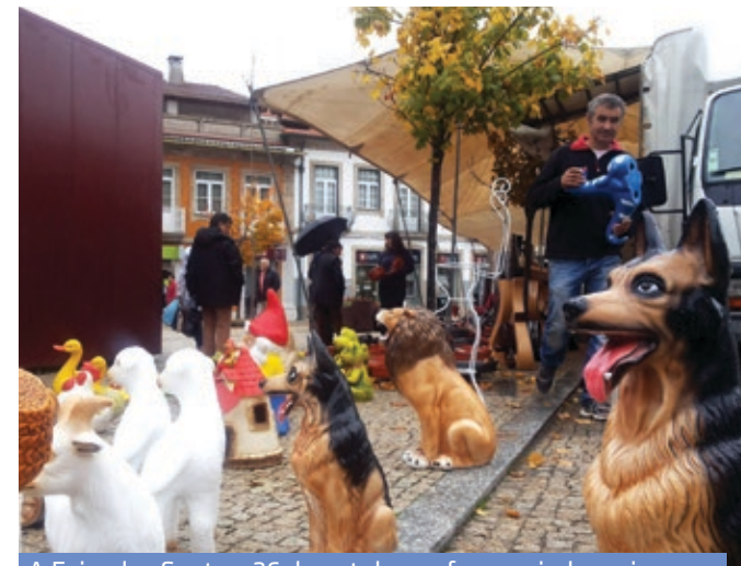
A Feira dos Santos, 26 de outubro, reforçou ainda mais a sua presença no centro histórico de Vila Pouca de Aguiar