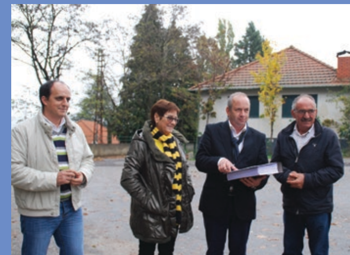
Receção provisória de Saneamento no Bairro dos Mineiros (Campo de Jales)