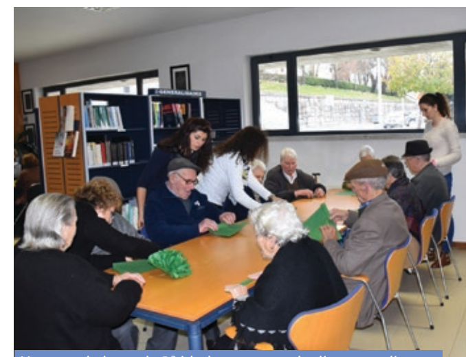
Utentes de lares de 3ª idade e centros de dia em atelier na Biblioteca com a execução de árvore natalícia