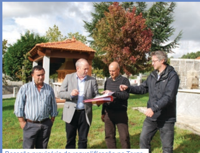
Receção provisória de requalificação no Torgo, na Freguesia do Alvão