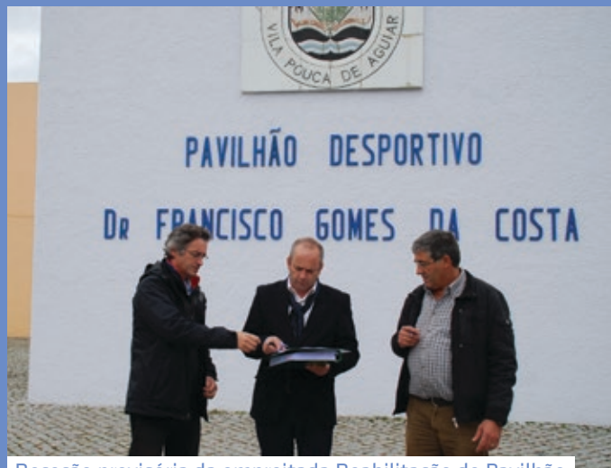
Receção provisória da empreitada Reabilitação do Pavilhão Francisco Gomes da Costa