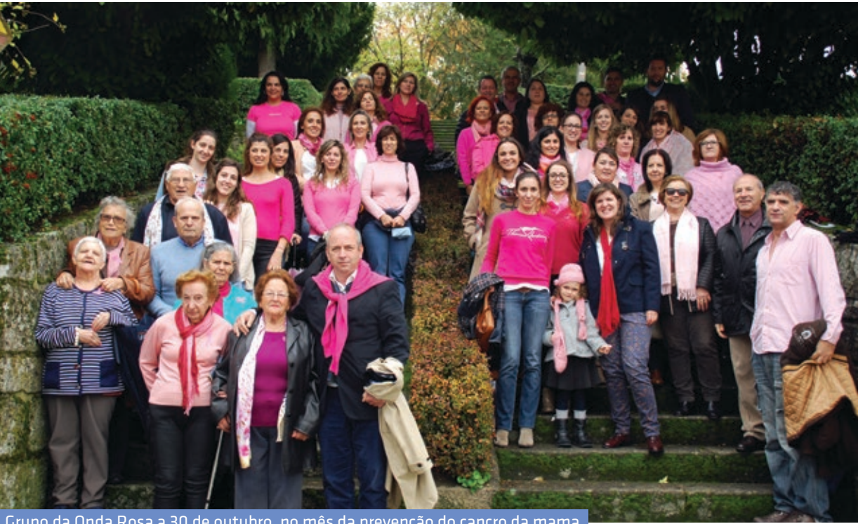
Grupo da Onda Rosa a 30 de outubro, no mês da prevenção do cancro da mama