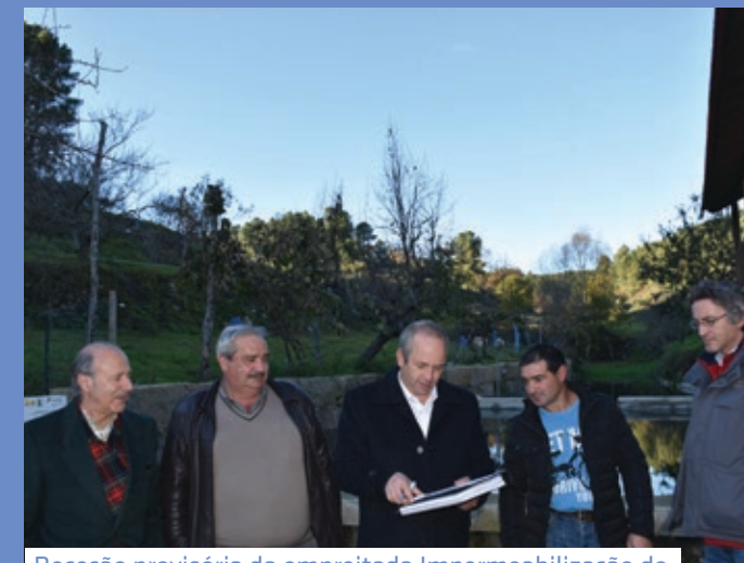
Receção provisória da empreitada Impermeabilização do Espelho de Água de Trêsminas