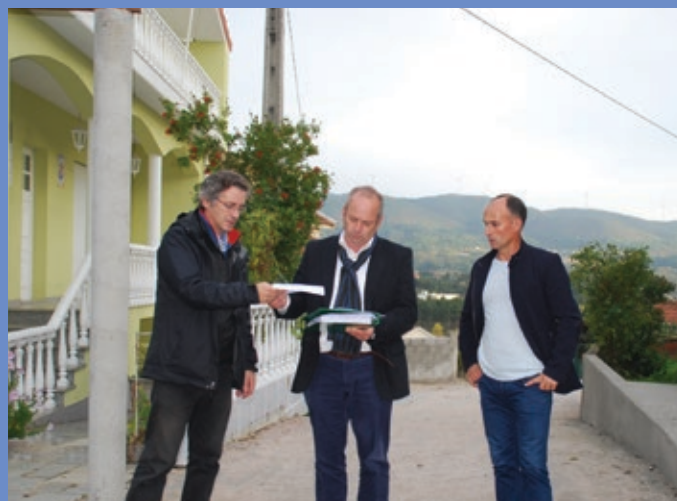
Receção provisória de Repavimentações da rua da Barroca e da rua do Ougueiro, em Sabroso de Aguiar