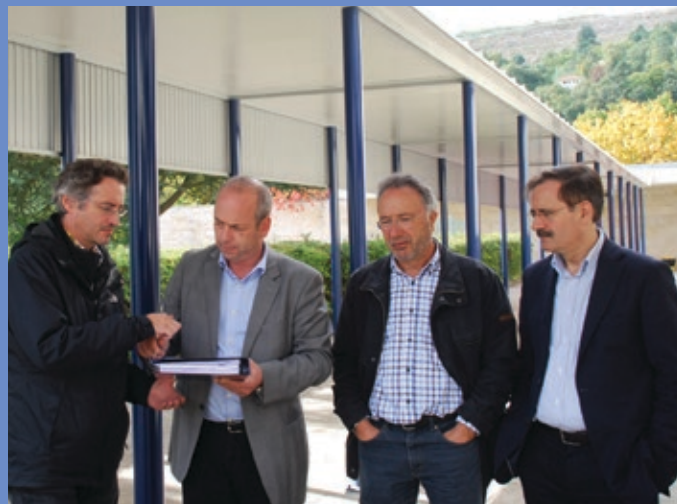
Receção provisória da empreitada Cobertura entre pavilhões escolares - Vila Pouca de Aguiar e Pedras Salgadas